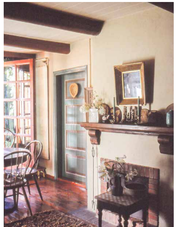
Martta Wendelin suunnitteli Kanervalan-taiteilijakotiinsa Annivaaraan englantilaistyyllisen takan sekä ranskalaisen ikkunan.