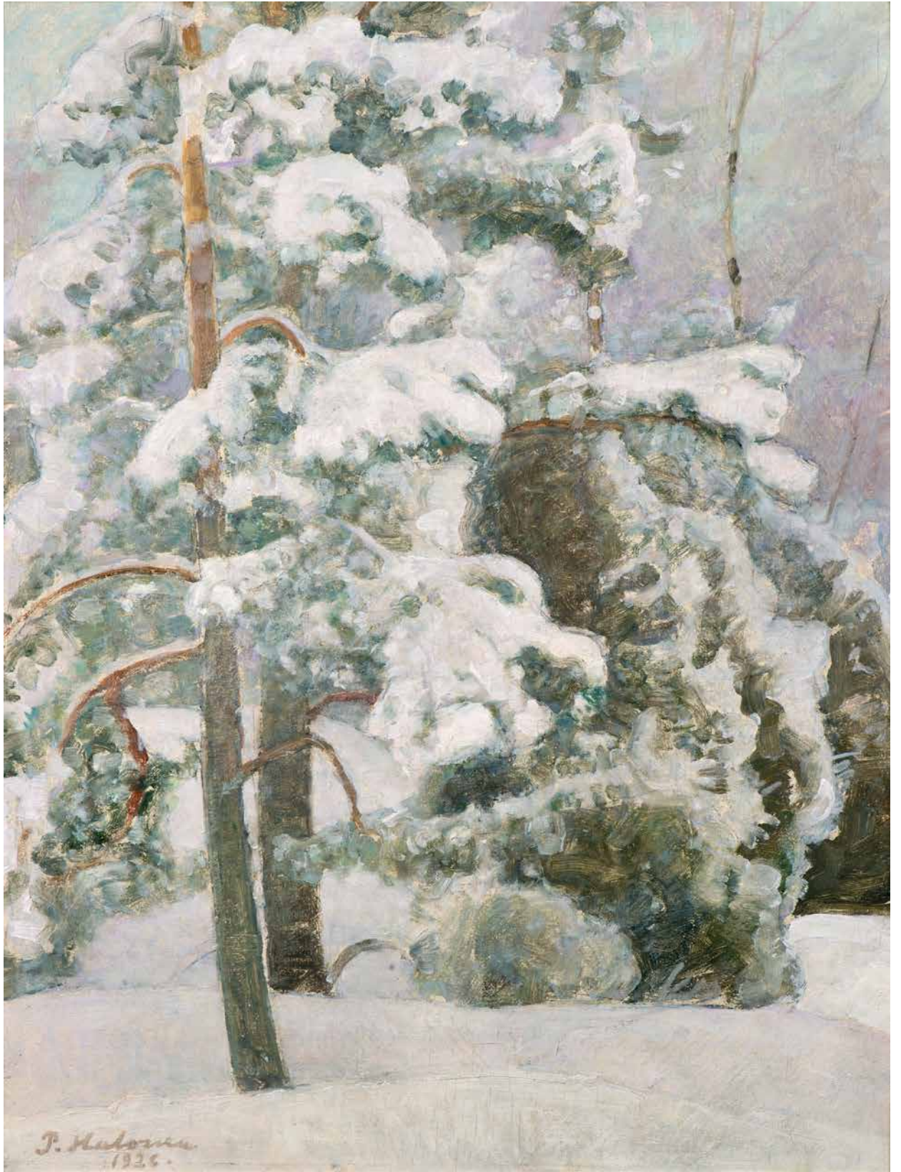
Pekka Halonen, Utuinen talvimaaisema, öljy 1926, Halosenniemen museo.

myös samalla taiteilijuudesta ja Tuusulanjärven taiteilijayhteisöstä. Osaan esineistä voidaan liittää mielenkiintoisia tarinoita; miksi ruokasalin uunissuulussa kuvataan emakkoa possuineen tai miksi suuren "Ateljeen sisäkuva" -maalauksen etuala on tyhjä? Onko hieno ranskalainen Luneville -ruoka-astiasto ainutlaatuinen Suomessa? Mitä tarinoita liittyy Pekka Halosen talvimaaisemien maalaamiseen ja hänen käyttämiinsä väreihin?