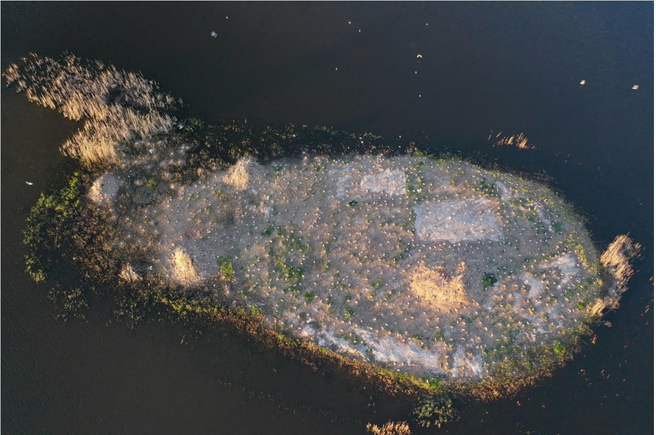
Kuva 4. Naurulokkiparit Seittelin länsisaarella 23.5.2022. Pesä on tasaisin välein, kautta koko saaren. Kuvaushetkellä kasvillisuus oli vielä matalaa talvikaudella tehdyn raivauksen jäljiltä. Kuvassa erottuvat kasvittomat alueet ovat maarakennuskankaalla avoimina pidettyjä alueita.