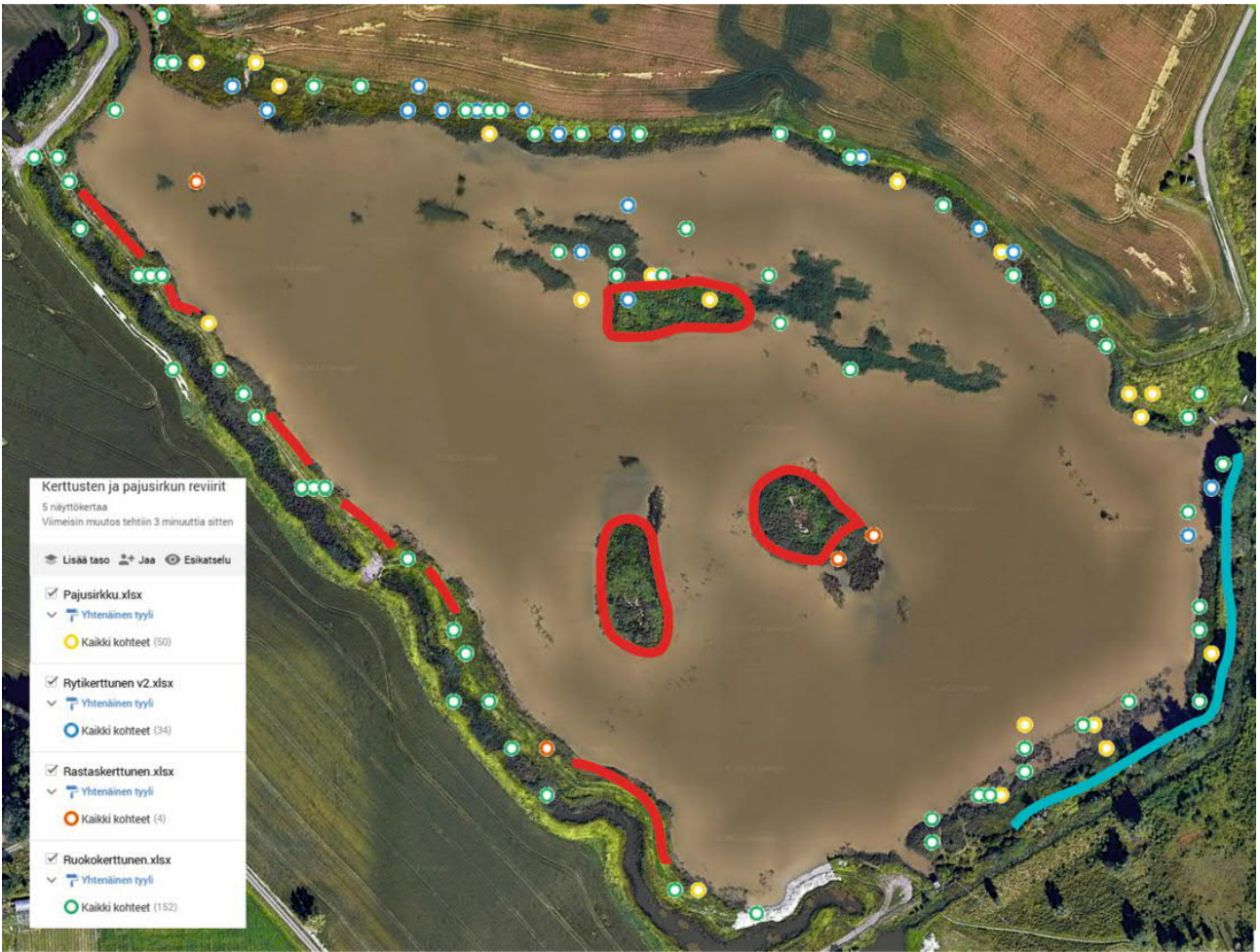
Kuva 3. Seittelin kosteikolla pesivien pajusirkun, rytikerttusen, ruokokerttusen ja rastaskerttusen tapaamispaikat 2022. Karttaan on merkitty punaisella rantaviivan alueet, joilta kasvillisuuden voisi poistaa maata myöten. Saarissa raivattavat alueet on ympyröity. Sinisellä on merkitty alue, jolta nuori tervalepikko yms. tulisi poistaa, jotta puoliavoin pensaikkoranta säilyisi pesimälinnustolle soveliaana.