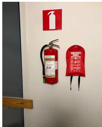
Sammutin ja sammutuspeite