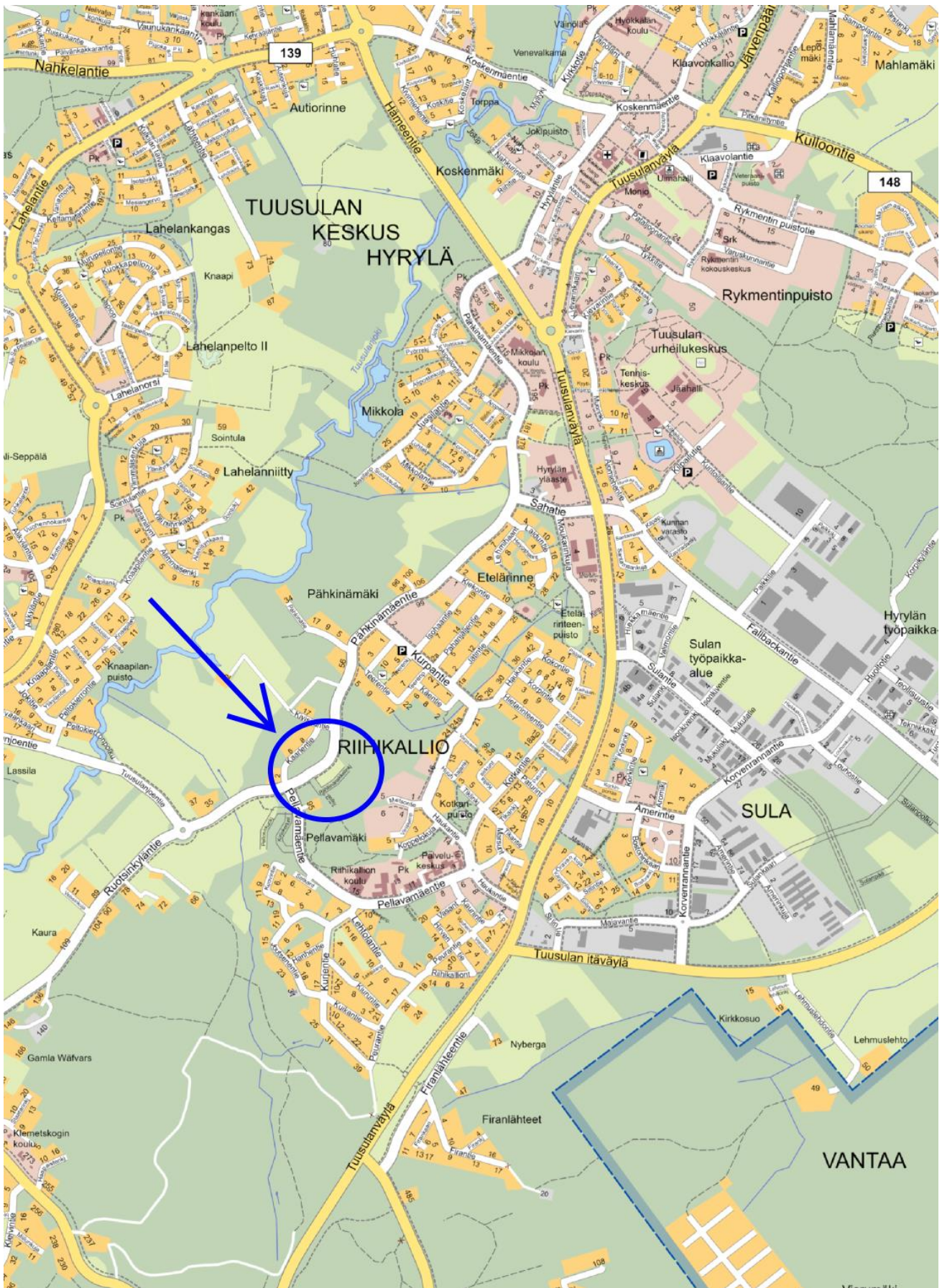
Ote opaskartasta, johon ko. alue rajattu