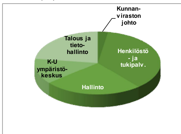
Toimintakulujen jakautuminen tulosalueittain