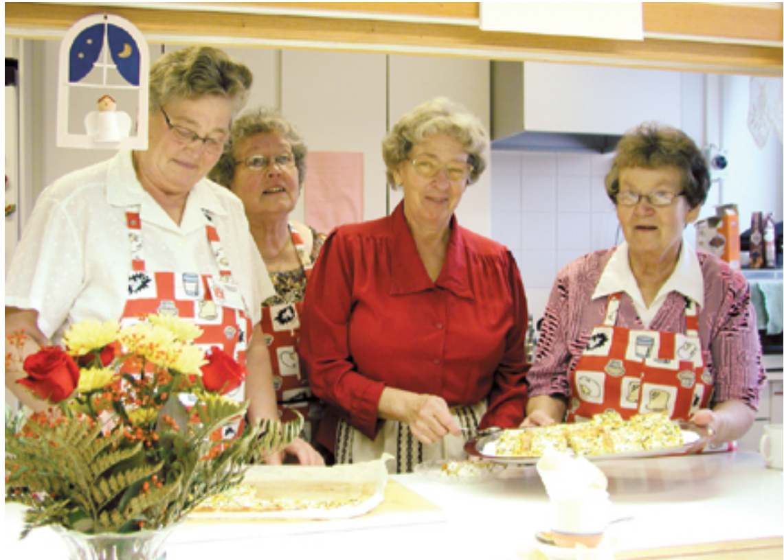
Mukavaa yhdessäoloa leipomisen merkeissä.