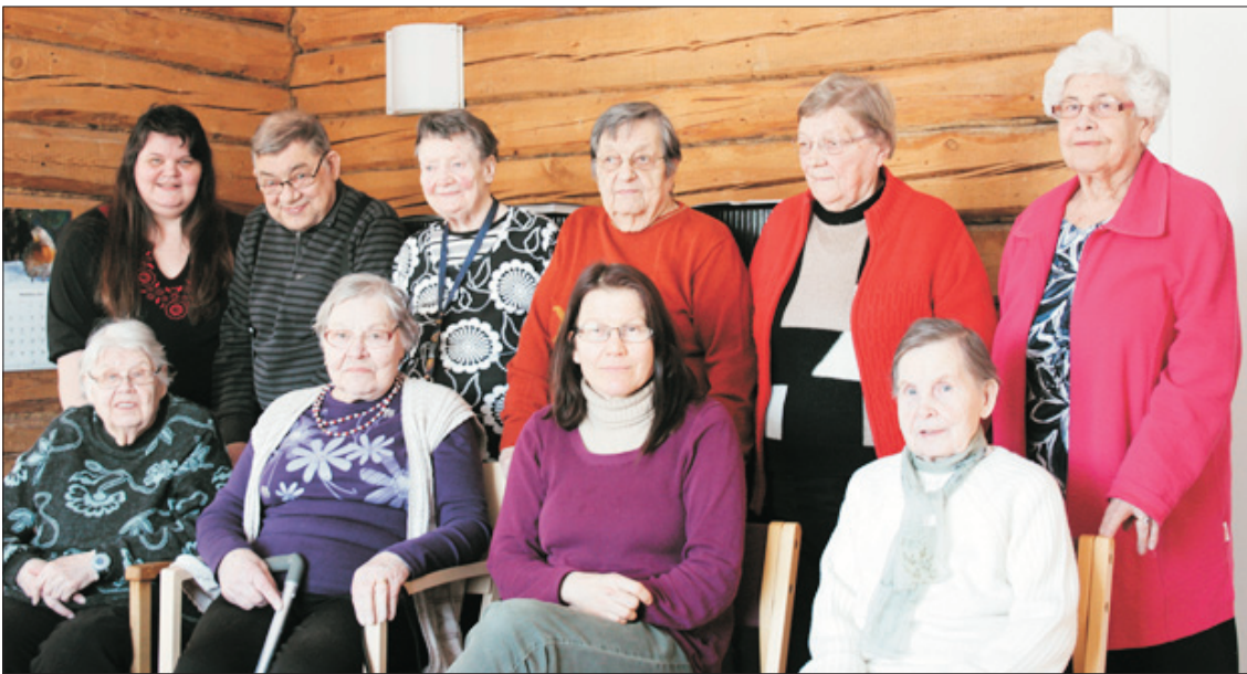
Päivätoiminnan iloinen ryhmä aurinkoisena kevätpäivänä.