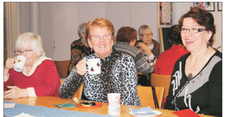
Marttana pääsee tutustumaan uusiin ihmisiin ja toimimaan yhdessä muiden marttojen kanssa.

Suomessa on yli 45 000 marttayhdistyksen jäsentä eli marttaa. Riihikallion Martat ry on Marttaliiton jäsenyhdistys, johon kuuluu noin 50 jäsentä ympäri Tuusulaa.