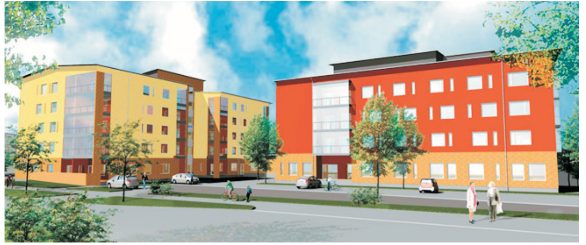
Kurkistus tulevaisuuteen. Riihikallioon rakennettava palvelukeskus tarjoaa asuntoja ja palveluita ikäihmisille.

Hyvinvointipalvelukeskusta suunnitellaan asumisen ja palveluiden kokonaisuudeksi, jossa asukkaat voivat asua itsenäisesti kotona mahdollisimman pitkään. Tavoitteena on luoda itse itseään tukeva yhteisö, jonka toteuttamiseksi haetaan ratkaisuja ja yhteistyökumppaneita. Hyvinvointipalvelukeskuksen perustuu Tuusulan kunnan sosiaali- ja terveyspalveluiden kehittämissuunnitelmaan.