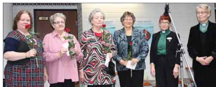
Tuvan kantavia voimia muistettiin kukkasien.

Jokaisella emännällä oli aikaa ja halua olla mukana omalla persoonallaan. Yhteisinä ansioina heillä kaikilla olivat muun muassa seuraavat: - emännät ovat halukkaita