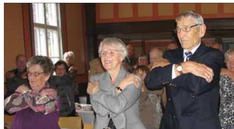
Eläkeläiset laitoivat juhlaväen virallisen osuuden jälkeen "halimaan" itseään.