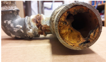
Yli 50 vuotta vanhat vesijohdot voivat kasvaa lähes umpeen ja heikentää veden laatua.

Kiinteistön ja vesihuoltolaitoksen vastuuraaja on vesijohtoverkon osalta runkovesijohdossa. Jätevesi- ja hulevesiverkoston osalta vastuuraaja on runkoviemäriässä tai liitoskaivossa. Myös kellari-tilojen padotusventtiili tai pumppaamo on kiinteistön vastuulla. Jos padotuskorkeuden alapuolisiin tiloihin tulvii viemäriävesiä, tulvasta aiheutuneet vahingot ovat kiinteistön omalla vastuulla.