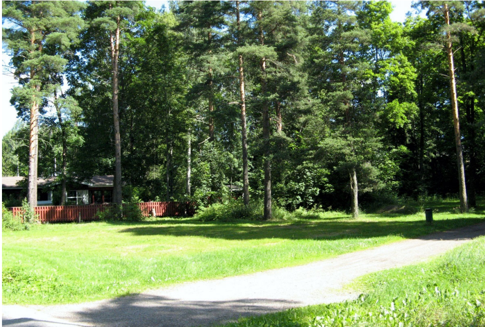
Kuva 4. Vaarinpuisto.

reunalla kasvoi hieman mukulaleinikkiä; mahdollisesti läheisistä puutarhoista levinneenä.