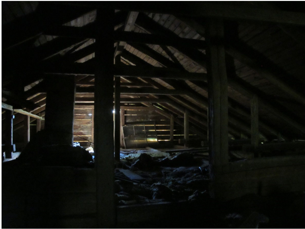
Kuva 5. Prijuutin purettavan rakennuksen ullakko.