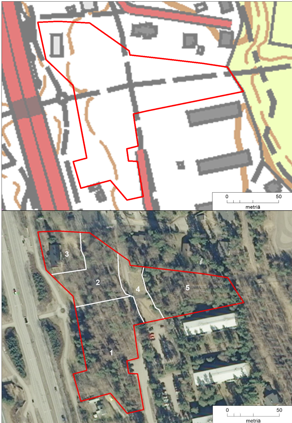
Kuva 1. Prijutuin selvitysalue (punainen raja) kartta- ja ilmakuvapohjalla. Tekstissä kuvatut osa-alueet 1–5 on merkitty alempaan kuvaan.