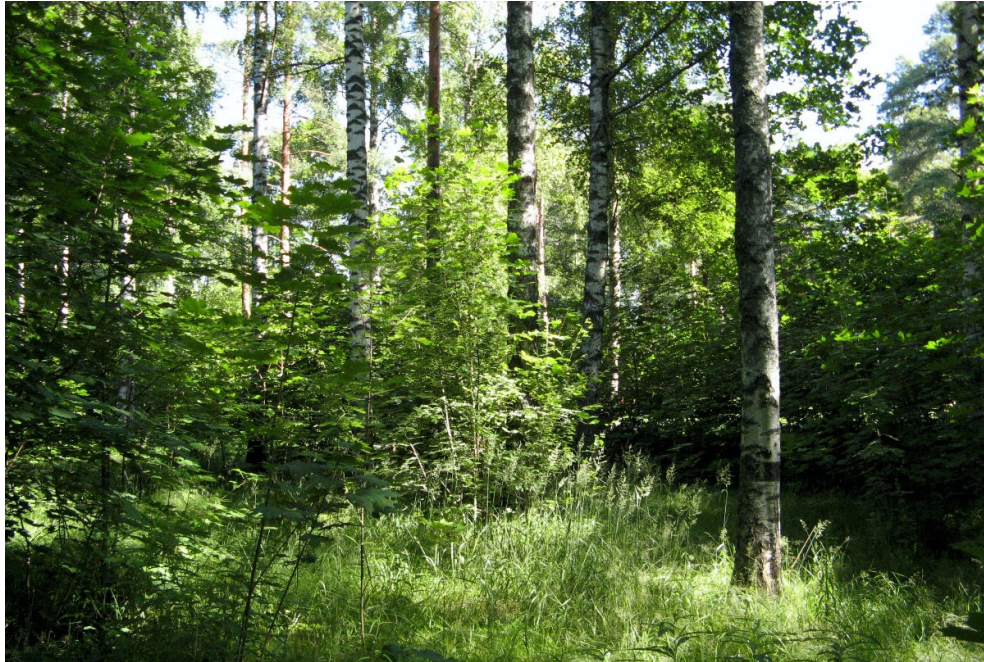
Kuva 3. Umpeutunutta entistä pihamaata selvitysalueen lounaisosassa.

korkeista vaahteroista ja raidoista (kuva 3). Aluskasvillisuus on kulttuurivaikutteista: lajistossa on mm. kioloa, nokkosta, koiranputkea, vadelmaa, kevättaskuruohoa, ojakellukkaa, jänönsalaattia, hietakastikkaa, niittynurmikkaa ja nurmirölliä. Eteläpäässä kasvaa myös joitakin jalopähkinöitä, mutta muita viljelyjäänteitä ei ole. Kuvion itäosassa kasvaa kevyen liikenteen väylän reunalla kulttuurikasvis-toa: keltamo, litulaukkaa ja kyläkellukkaa.