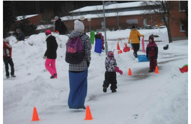
Kuva 7 Seurakunnan kaikille avoin liikkuva perhekerho tarjoaa toimintaa koko perheelle.