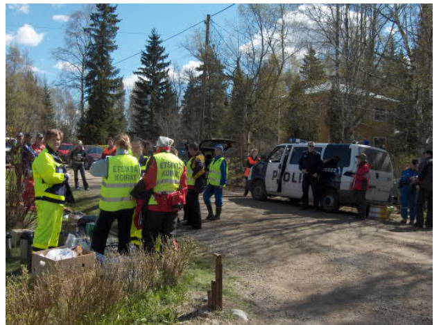
Kuva 6 SPR:n kautta voidaan kanavoida ja koordinoita monenlaisia auttamistoimintaa.

Osaston jäsenillä on mahdollisuus kouluttautua henkisen ensiavun antamiseen, kuten myös turvapaikan hakijoiden kanssa toimimiseen. Helsingin ja Uudenmaan piirin toimesta koulutukset voidaan järjestää pikaisellakin aikataululla. Jonkin verran on myöskin osastolle tullut kyselyjä ko. toimintaan osallistumisesta - suomalainen haluaa kuitenkin lähtökohtaisesti aina auttaa.