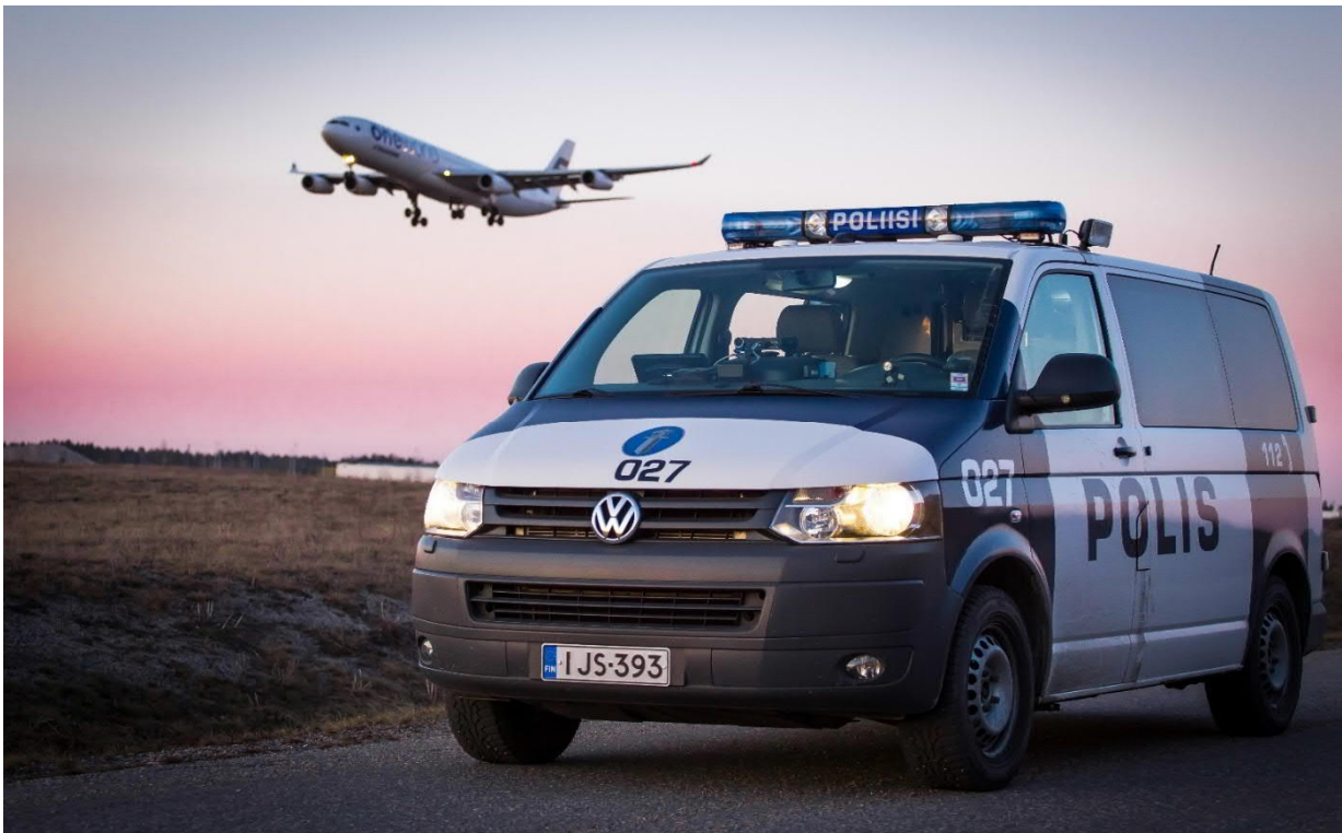
Kuva 5 Poliisin tietoon tulee vain osa liikenne rikkomuksista. Liikenteessä liikkuja voi omalla asianmukaisella käytöksellään lisätä liikenteen turvallisuutta ja kanssaihmisten turvallisuudentunnetta.

https://www.poliisi.fi/liikenneturvallisuus