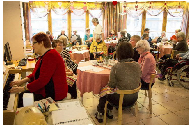
Kuva 8 Hyvän Tuulen Tuvilla eri puolilla Tuusulaa kokoontaan juttelemaan, laulamaan ja kahvittelemaan. Tuvilla toimivat vapaaehtoiset isännät ja emännät.