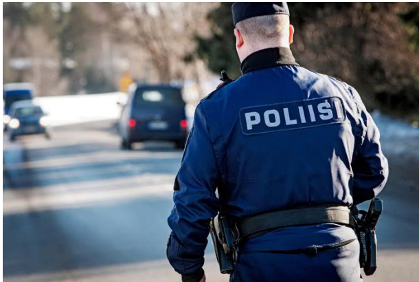
Kuva 3 Liikenteen turvallisuuden lisäämisessä tarvitaan viranomaisten lisäksi myös yksityisten tahojen ja kolmannen sektorin panosta.

Koettu liikenneturvallisuuden parantuminen vaikuttaa ihmisten elämänlaatuun ja hyvinvointiin, elinympäristöjen viihtyisyyteen ja liikkumisvalintoihin.