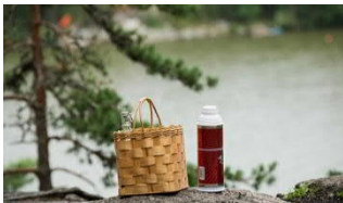
Kuva 2.

Turvallisuus ja turvallisuuden tunne syntyvät monen asian yhteisvaikutuksesta, ja monen toimijan yhteistyön tuloksena. Panoksensa ja arvokkaan näkemyksensä ovat antaneet yksittäiset kuntalaiset, kehittämistoimikunnat, kunnan eri toimijat, sekä viranomaiset ja yhteisöt.