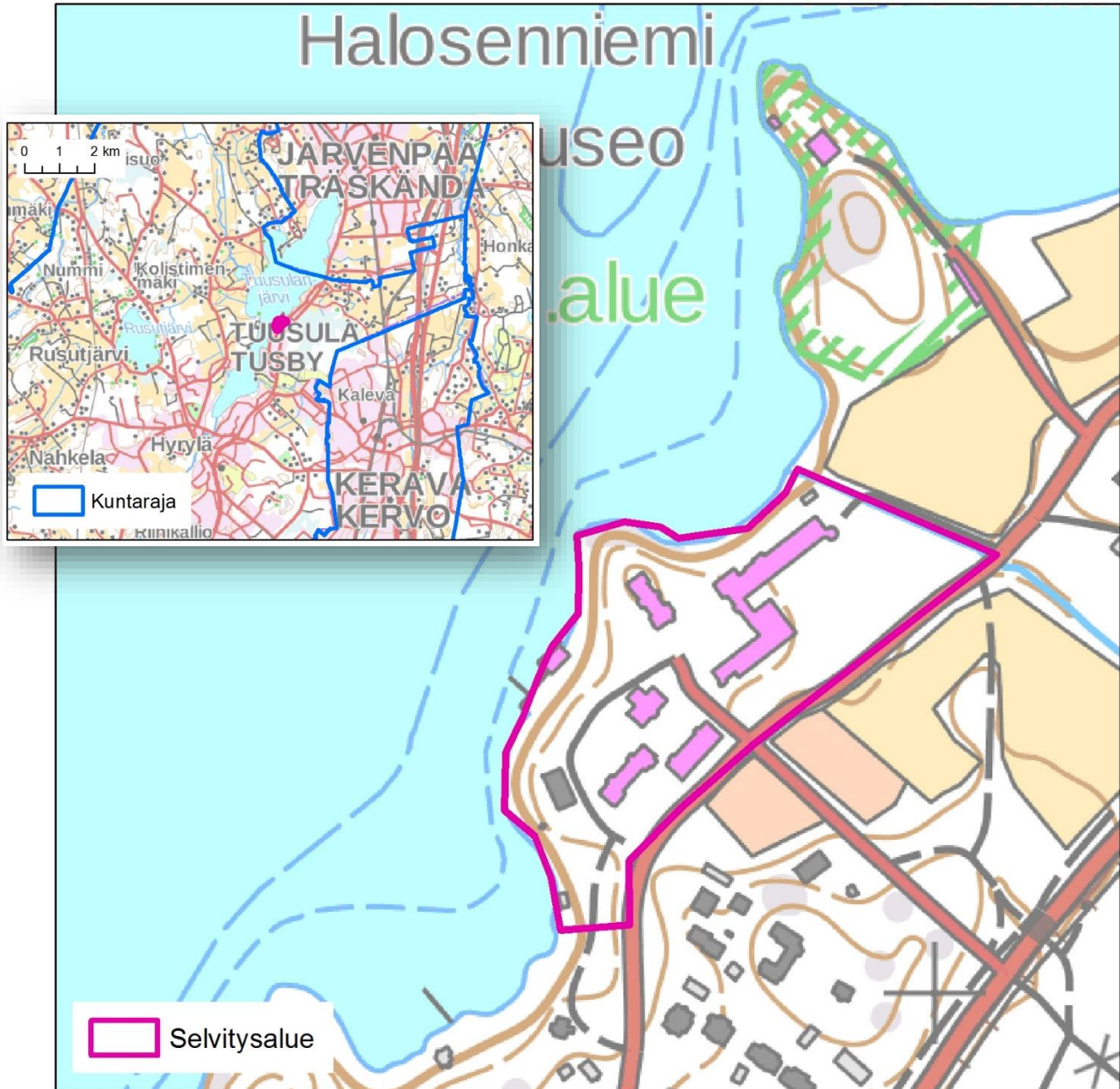
Kuva 1. Selvitysalue.