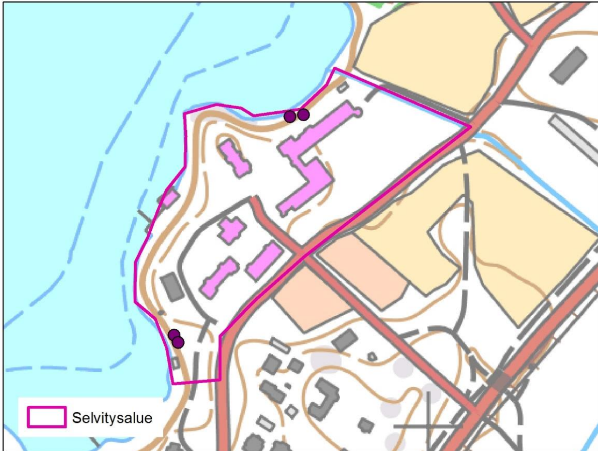
Kuva 1.1. Viitasammakkoselvityksen kuuntelupisteet. Selvityksessä ei havaittu viitasammakoita.

● Viitasammakkoselvityksen kuuntelupisteet