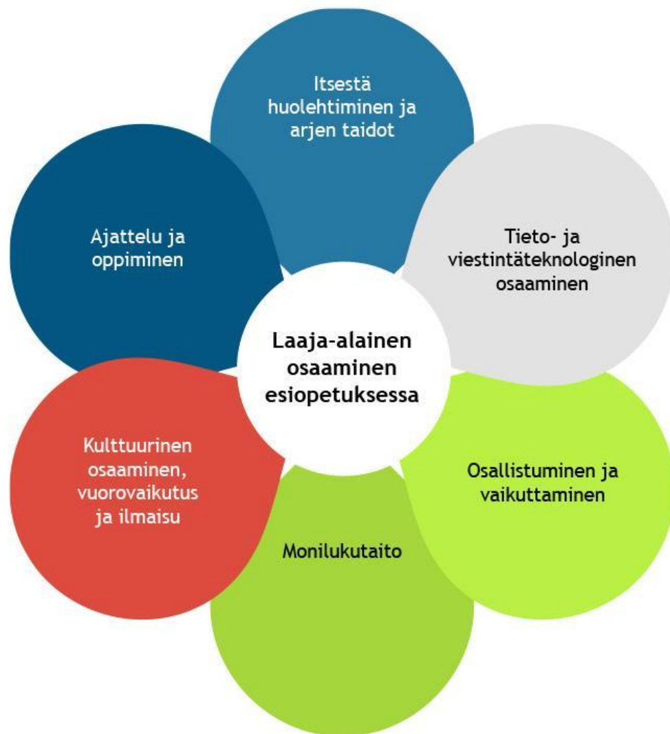
Kuva 2. Laaja-alainen osaaminen

Esiopetuksessa painopisteenä ovat kestävän kehityksen tavoitteet. Tuusulan kunnan sivistystoimi on sitoutunut YK:n kestävän kehityksen toimintaohjelmaan Agenda 2030. Toimintakulttuuri esiopetuksessa rakentuu kestävän kehityksen tavoitteille. Lapset saavat näiden tavoitteiden edistämiseen tarvittavia tietoja ja taitoja. Esiopetus ohjaa kulttuurisen moninaisuuden ymmärtämiseen ja arvostamiseen. Esiopetuksessa välitetään kulttuuriperintöä ja tuetaan lasten kulttuuri-identiteettiä. Lasten monilukutaidon kehittymistä vahvistetaan yhteistyössä huoltajien kanssa. Kehitämme esiopetuksessa kielitietoisia toimintatapoja ja arvostamme kielellistä monimuotoisuutta.