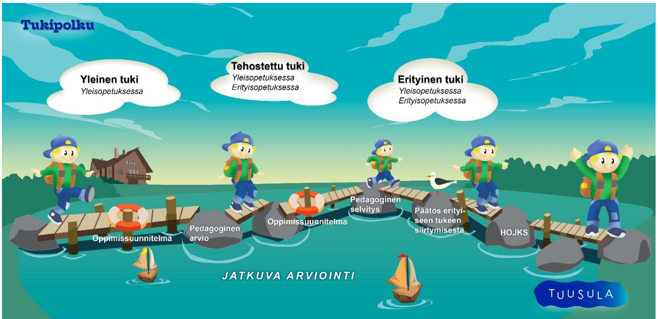
Kuva 8. Tukipolku