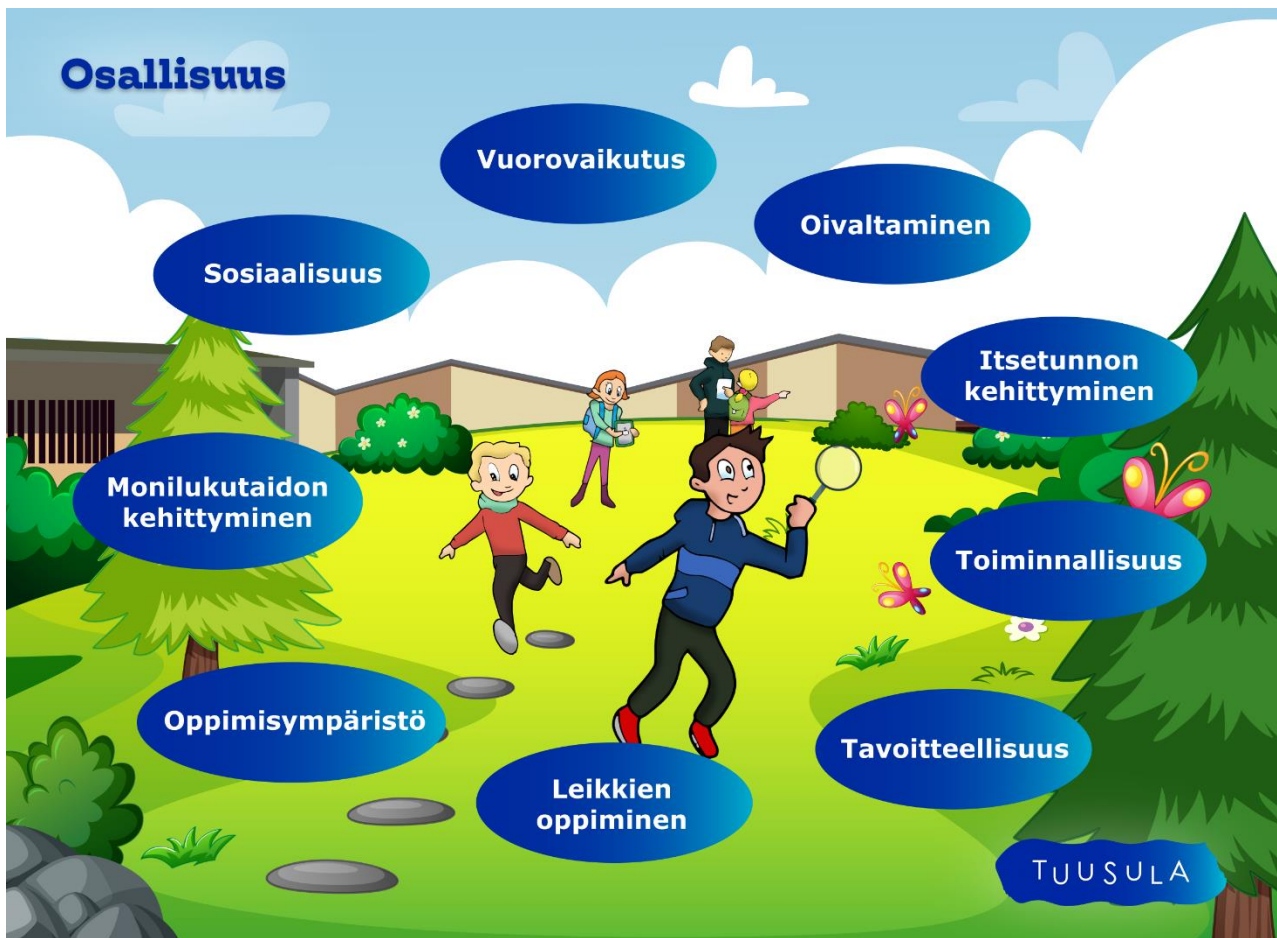
Kuva 4. Osallisuus