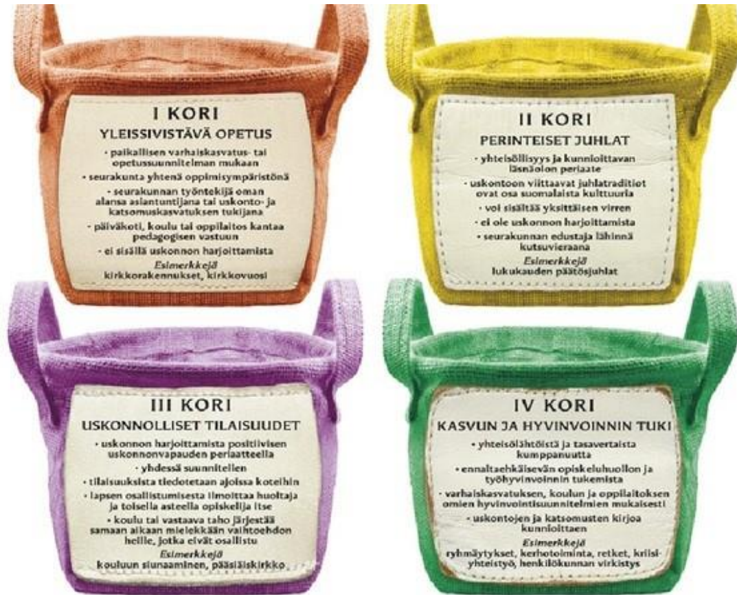
Kuva 6. Korimalli

Perinteisiin juhliin voi kuulua myös uskonnonharjoittavaa katsomuskasvatusta. Näitä voivat olla esimerkiksi seurakunnan järjestämä joulukirkko ja/tai pääsiäistäpahtuma. Esiopetusryhmä järjestää samanaikaisesti vaihtoehtoja, ei uskonnollista toimintaa. Esiopetusryhmä tiedottaa tunnustuksellisen tilaisuuden sisällöstä ja vaihtoehtoisen toiminnan sisällöstä, jonka jälkeen huoltajat tekevät valinnan kumpaan toimintaan lapset osallistuvat. Esiopetuksen järjestämissä juhlissa voidaan kulttuurikasvatuksen nimissä laulaa yksittäinen uskonnollinen laulu, kuten Suvivirsi.