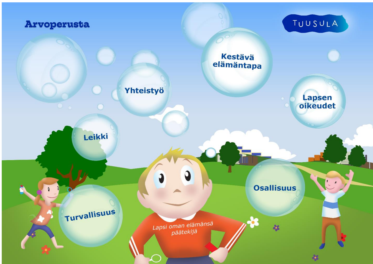
Kuva 1. Arvoperusta