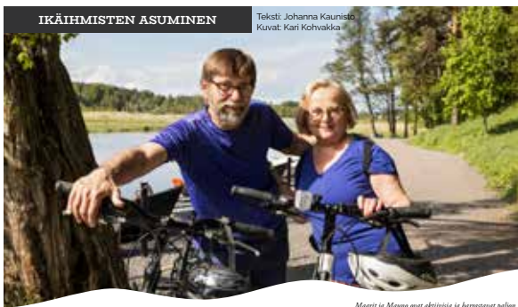
Kekki: Johanna Kaunisto