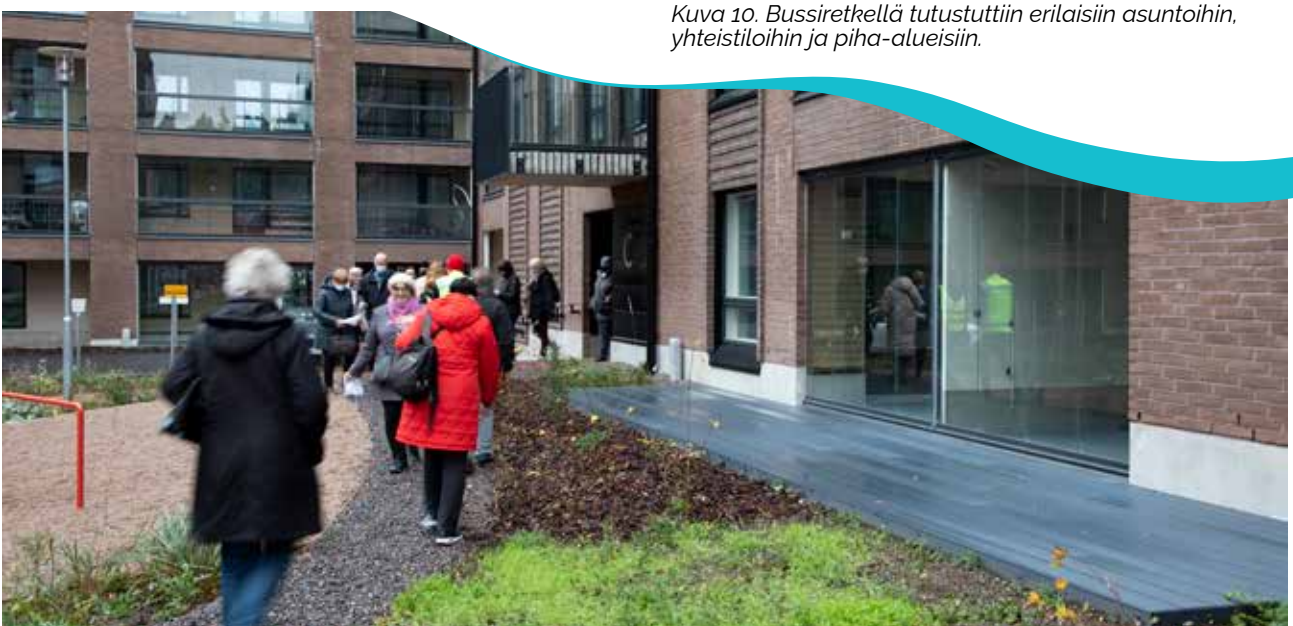
Kuva 10. Bussiretkellä tutustuttiin erilaisiin asuntoihin, yhteistiloihin ja piha-alueisiin.

Bussiretkistä saatiin hyvää palautetta sekä osallistujilta että rakennusliikkeiltä. Retkiä on tarkoitus jatkaa yhteistyössä rakentajien kanssa mahdollisuuksien mukaan myös keväällä 2023.