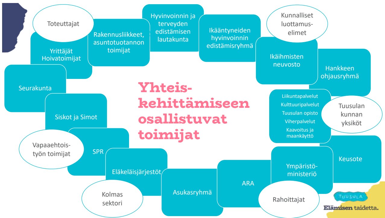
Kuva 7. Yhteiskehittämiseen osallistuvat toimijat.

Tuusulan kunnan asuntopalvelut vastasi hankkeen vetämisestä. Hankkeessa tehtiin läheistä yhteistyötä kunnan kaavoituksen, maankäytön ja hyte- ja osallisuustiimin kanssa. Hyte- ja osallisuustiimi vastasi Kalliopohjan olohuone toiminnan järjestämisestä.