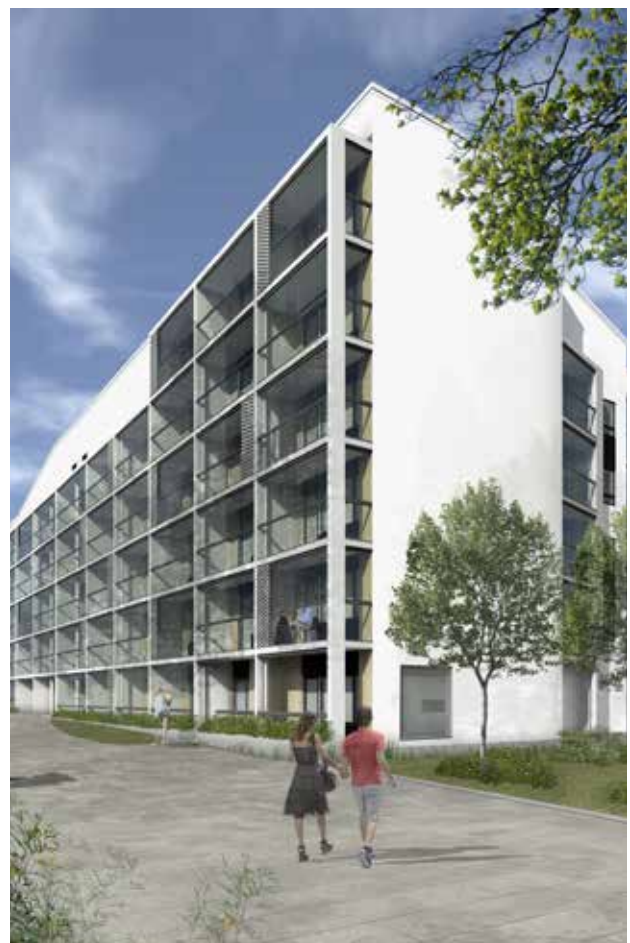
Kuva 4. Avain Yhtiöiden yhteisöllinen vuokratalo Agassit rakentuu Rykmentinpuistoon. Arkkitehdit Sivula & Sivula Oy

Kohteissa on asukkaiden käytössä erilaisia asumisviihtyvyyttä ja yhteisöllisyyttä lisääviä yhteistiloja. Myös piha on suunniteltu asukkaiden yhteiseksi oleskelualueeksi. Kohteet sijaitsevat lähellä palveluita, hyvien joukkoliikenneyhteyksien varrella.