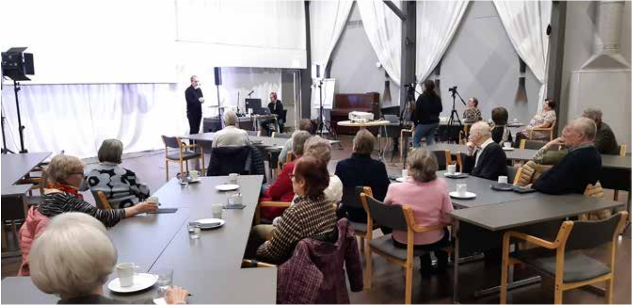
Kuva 8. Yhteisöllisen asumisen illassa kuultiin kokemusasiantuntijan pohdintoja yhteisöllisyyden tuomasta turvasta.