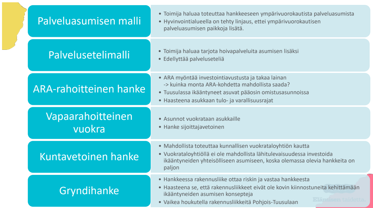
Kuva 6. Ikääntyneiden asumista tuottavat toimijat ja konseptit.

Ajankohtainen kysymys on, miten ikääntyvien asumisen asiat ja niiden kehittäminen otetaan huomioon hyvinvointialueilla ja miten ikääntyvien hyvinvointia voidaan edistää yhteistyössä kuntien ja hyvinvointialueiden kesken. Kunnissa ja hyvinvointialueilla ikääntyvien asumisen kehittäminen on vaarassa pudota "harmaalle alueelle". Kenen vastuulla on kehittää ikääntyvien asumista?