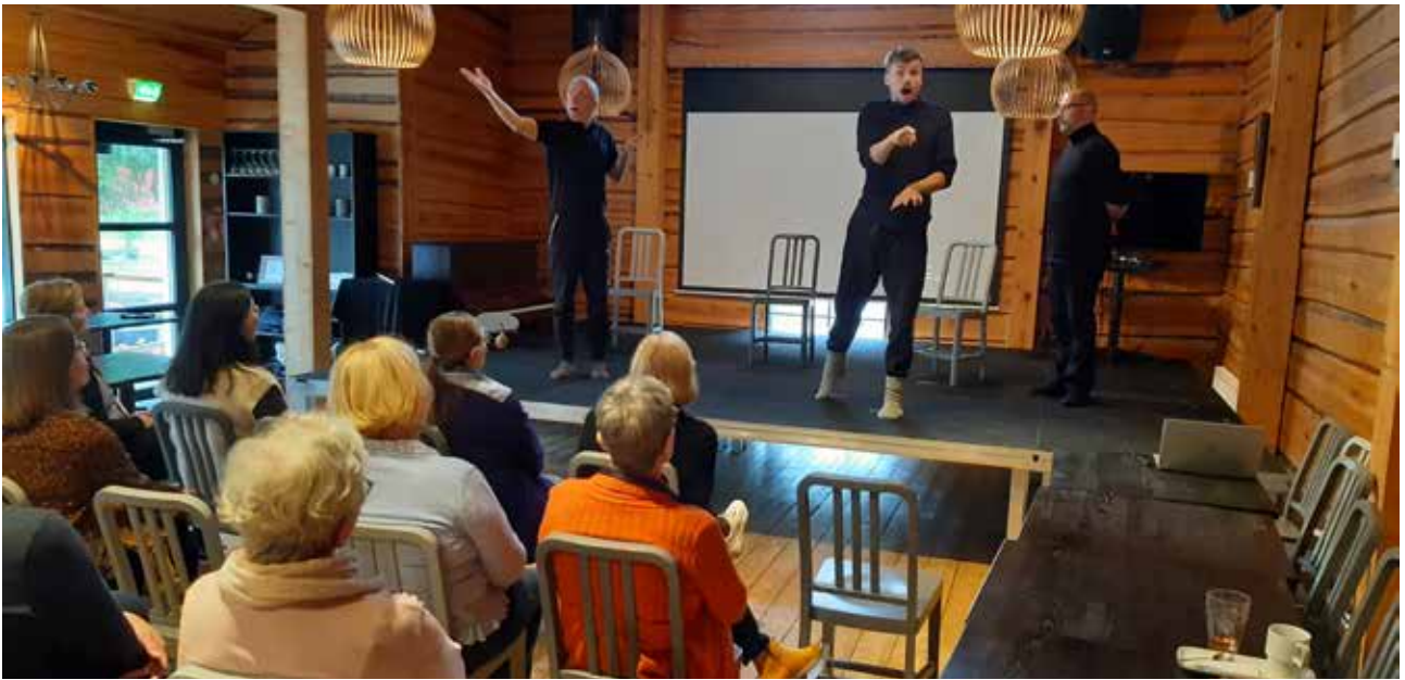
Kuva 9. Elämää elinvuosiin -työpajassa hyödynnettiin tarinateatterimenetelmää.