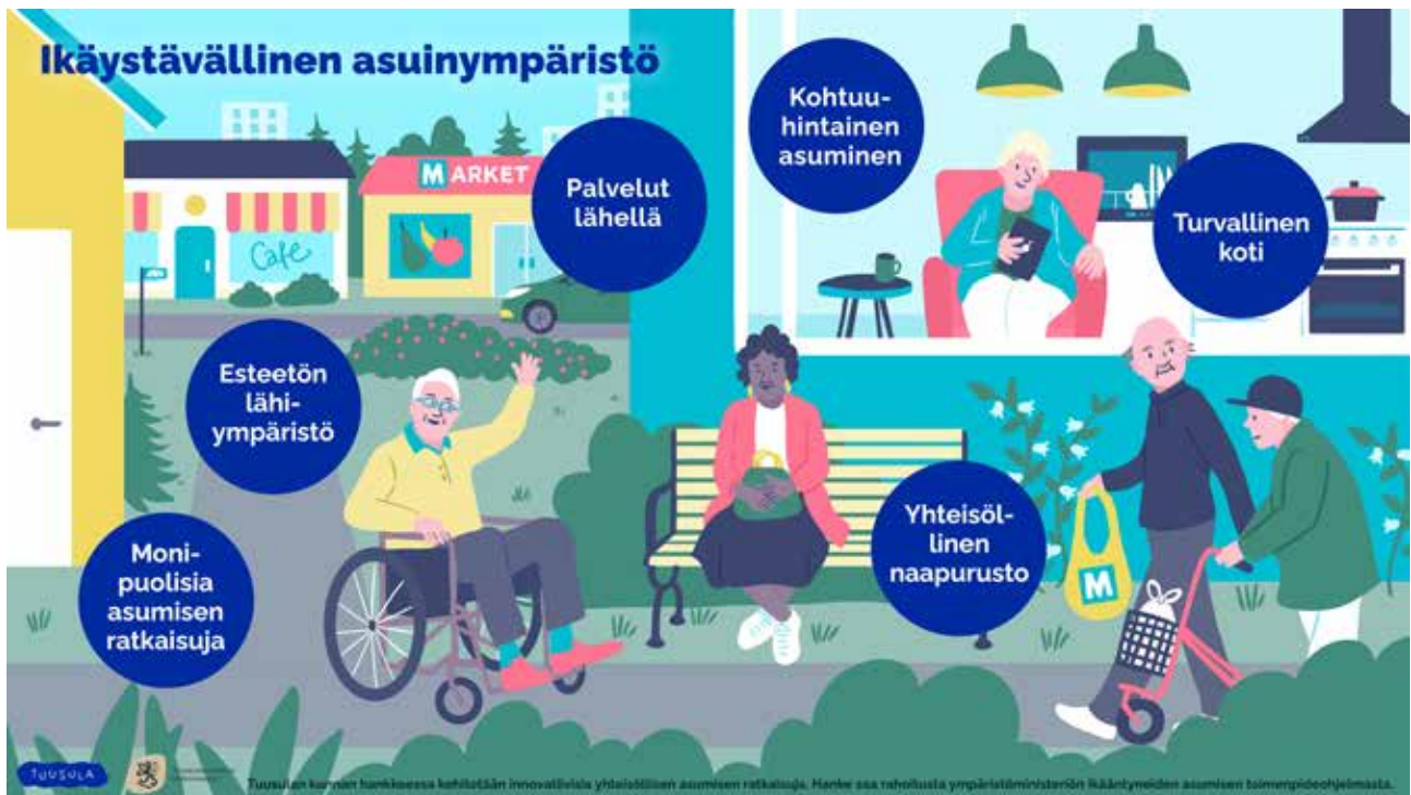
Kuva 2. Ikääntyvien tarpeita ja toiveita ikäystävällisessä asuinympäristössä.