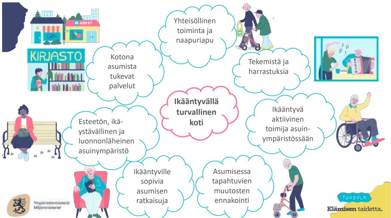
Kuva 5. Tuusulan yhteisöllisen asumisen toimintamalli.

Hankkeessa laadittiin yhteisöllisen asumisen toimintamalli. Toimintamallissa onnistuttiin yhdistämään monialaisia näkökulmia asumiseen. Toimintamallissa on vahvasti mukana oman kodin ja talon lisäksi ikäystävällinen asuinympäristö. Ikäystävällinen asuinympäristö nähtiin kostuvan fyysisen ympäristön lisäksi palveluista, liikkumismahdollisuuksista, osallisuudesta ja naapuruston yhteisöllisyydestä.