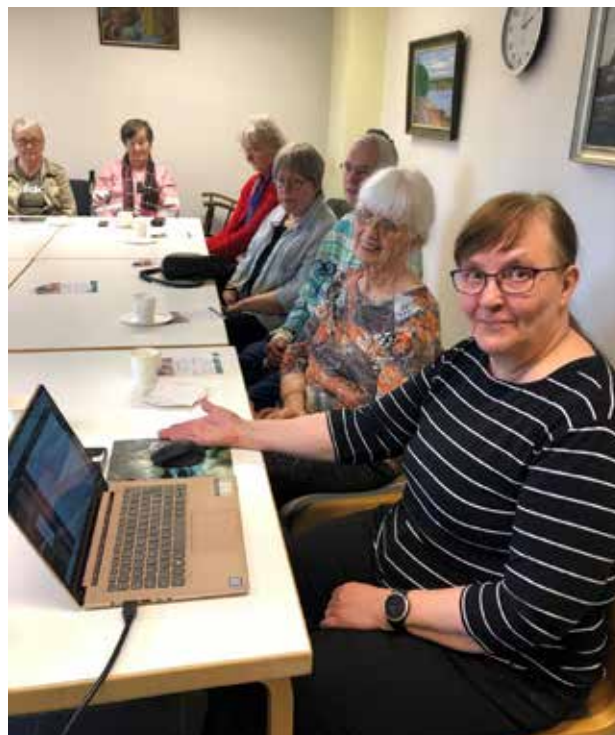
Kuva 3. Enter ry. vieraillee Kalliopohjan olohuoneella.