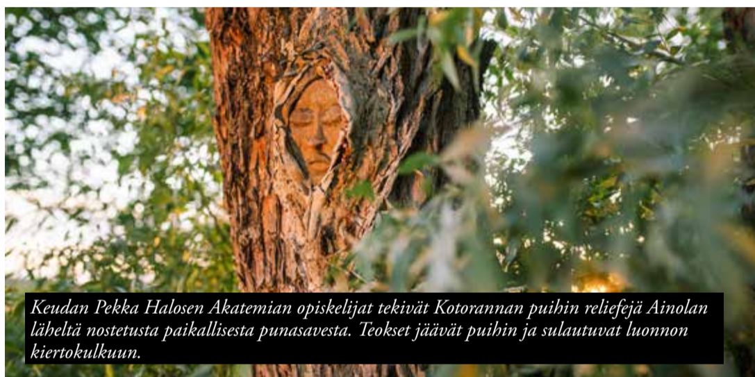
Keudan Pekka Halosen Akatemian opiskelijat tekivät Kotorannan puihin reliefejä Ainolan läheltä nostetusta paikallisesta punasavesta. Teokset jäävät puihin ja sulautuvat luonnon kiertokulkuun.

”Livemusiikki, hieno ympäristö, pieniä pajoja joihin helppo osallistua halutessa.”