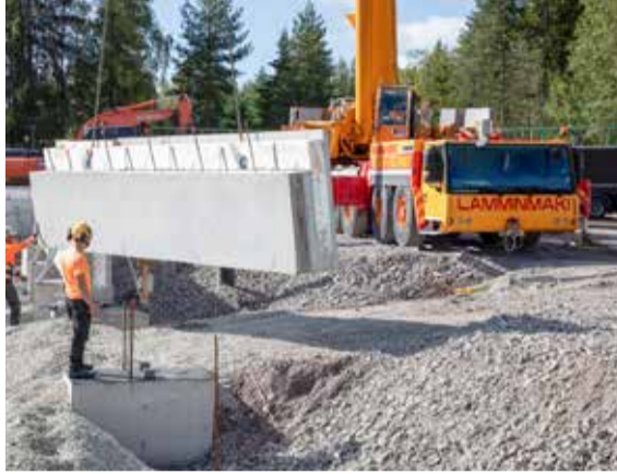
Elementtien asennusta Riihikallion kampuksella.

Kulttuurikunnan perinne näkyy esimerkiksi palveluverkon taideohjelmassa, jossa kohteisiin sijoitetaan taidetta käyttäjien ja ohikulkijoidenkin iloksi. Kulttuurinälän ja silmänilon lisäksi raken-