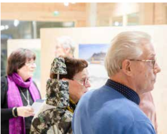
Monion tiloissa voi ihailia myös kuvataiteilijoiden teoksia.