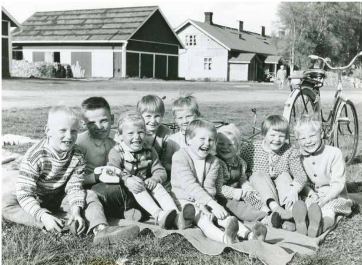
Kellokosken tehdasyhteisön lapsia 1959.

– Pyrimme tallentamaan koko Tuusulan historiaa. Siksi myös materiaali Tuusulan kylistä ja