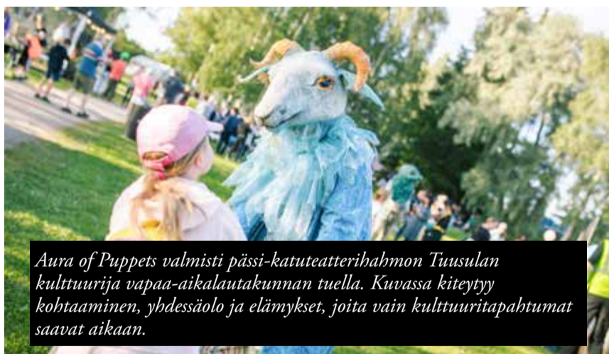
Aura of Puppets valmisti pässi-katuteatterihahmon Tuusulan kulttuuri- ja vapaa-aikalautakunnan tuella. Kuvassa kiteytyy kohtaaminen, yhdessäolo ja elämykset, joita vain kulttuuritapahtumat saavat aikaan.

työhuoneidensa ovet, ja työpajoissa tehtiin taidetta eri tekniikoin, kuten maalaamalla ja itse tehdyltä hiilellä piirtäen. Paikalliset bändit ja vaikuttava tulishow kruunasivat illan. Jokelan musiikkitarjonta oli jazz-painotteista sekä kirjastolla että tiilitehtaalla, ja aseman taiteilijoiden opissa syntyi niin taikatemppeja, saippuakuplia kuin savitöitäkin. ●