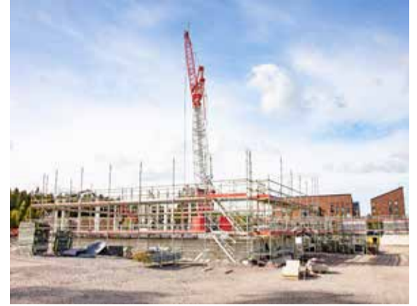
Rykmentinpuiston kampus on Tuusulan kunnan suurin rakennushanke.