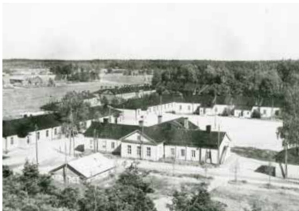
Hyrylän puuvaruskunta 1940-luvulla.