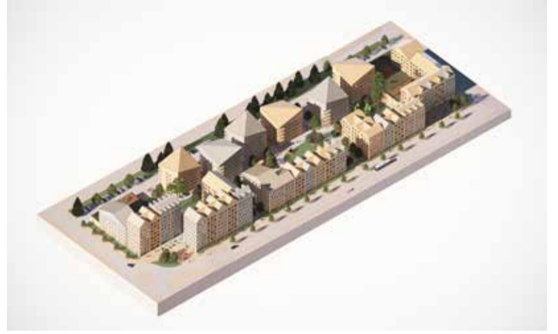
Havainnekuva Rykmentipuiston ikäystävällisestä asuinkorttelista.