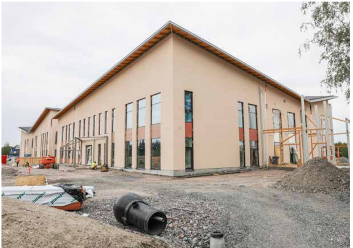
Tuusulanjärven kampus on saanut vaalean ulkoverhouspinnan.

tamisessa pidetään mielessä niin sisäilman laadun turvaaminen kuin kestävän kehityksen periaatteet.