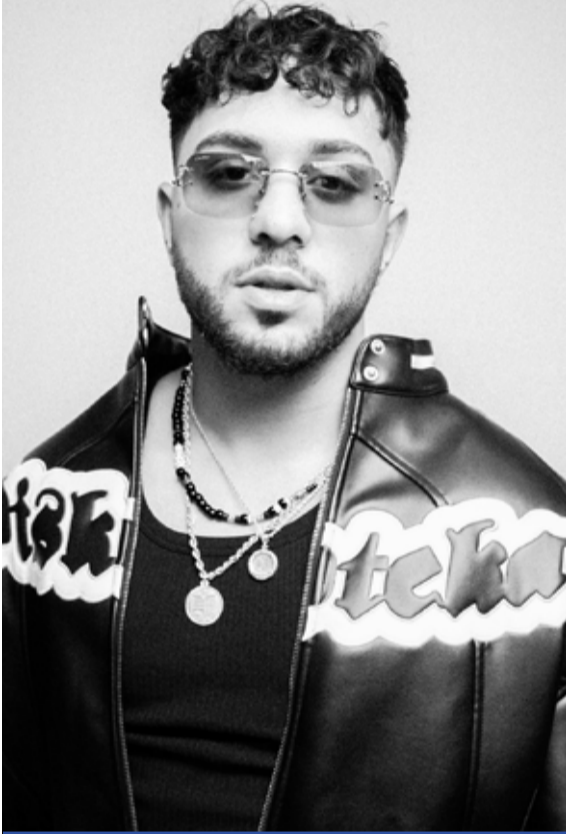
Faben keikka Kartano-salissa 13.4.

Olemme Monion kanssa vasta pitkän suhteemme alkutaipaleella, tutustumisvaiheessa. Jo ensiaskelista lähtien on ollut selvää, että Monio tarjoaa Tuusulan kunnalle ammattimaiseen kulttuuriin soveltuvat tilat, jollaisia tänne on kaivattu jo pitkään. Mihin kaikkeen uusi tila taipuu, se nähdään vasta tulevaisuudessa.