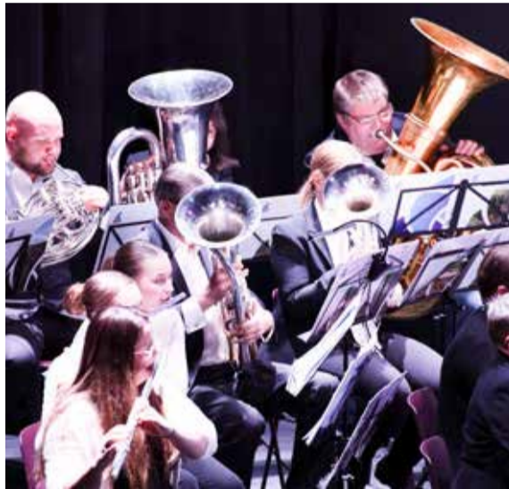
Keskisen Uudenmaan Musiikkiopiston orkesteri ja Kumpu-puhallinorkesteri esittelivät osaamistaan kuulijoille.