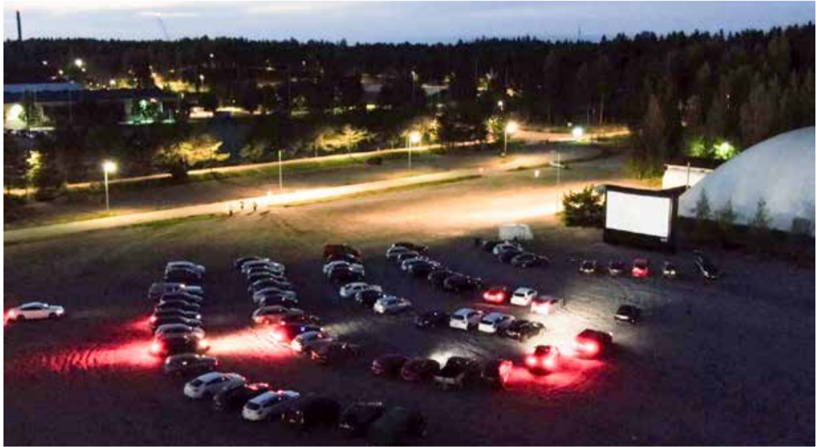
Drive-in -elokuvaesitys järjestettiin Urkassa ensimmäistä kertaa vuonna 2021.

– Tuusulan kunta on tukenut elokuvaamme taloudellisesti. Ilman tätä tukea leffa ei olisi ollut mahdollinen. Elokuvasa näyttelee monia paikallisia nuoria, joten Maahisten valikoitumisella