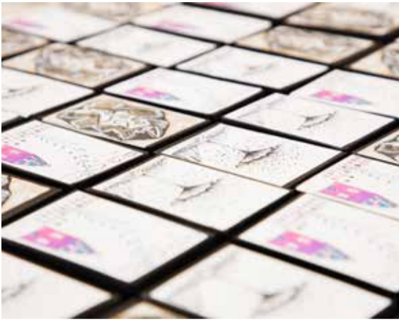
Konserttikävijät saivat mukaansa kuvataidekoulun tekemiä salaperäisiä ihmisiä.