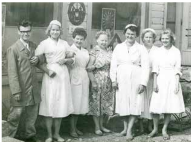
Osuuskauppa Tehon Jokelan myymälän henkilökunta poseeraa kaupparakennuksen edessä.