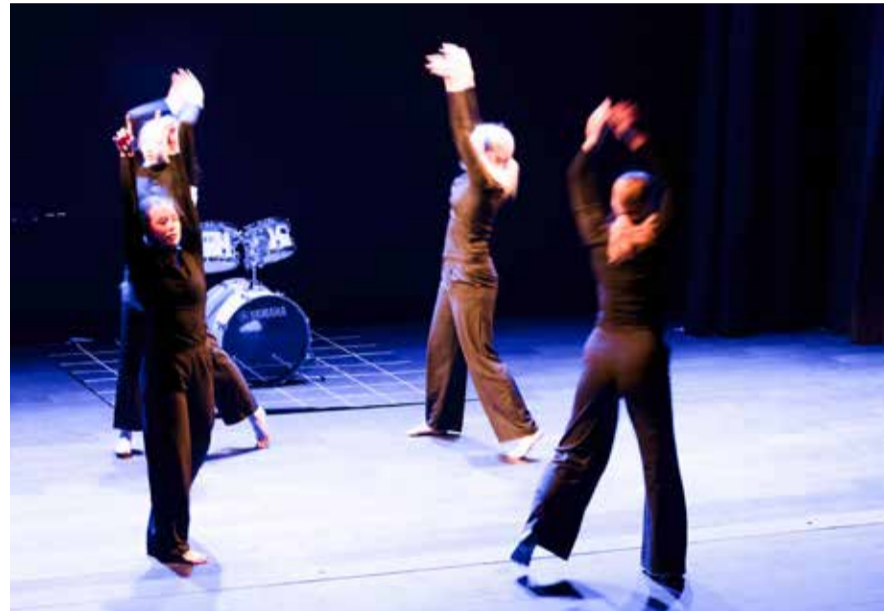
Tilaisuudessa päästiin nauttimaan myös tanssitaiteesta, jota tarjosi Keski-Uudenmaan Tanssiopisto Keto.