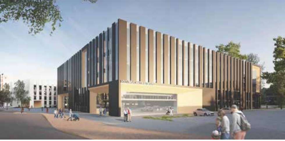
Alustava luonnos hyvinvointikeskuksesta.