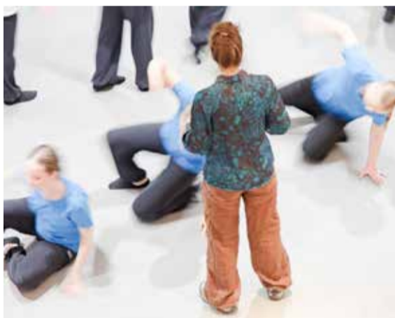
Viimeiset verryttelyt illan ohjelmaa varten.