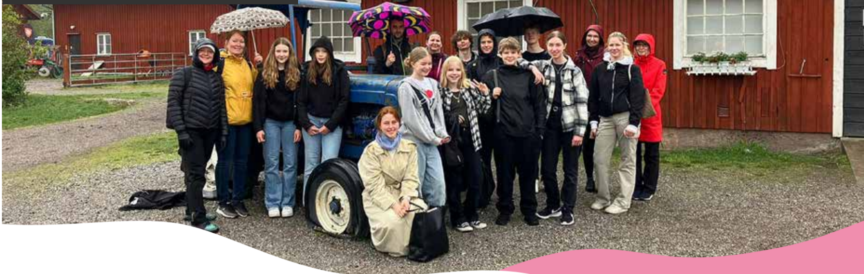
Teksti ja kuva: Laura Aalto