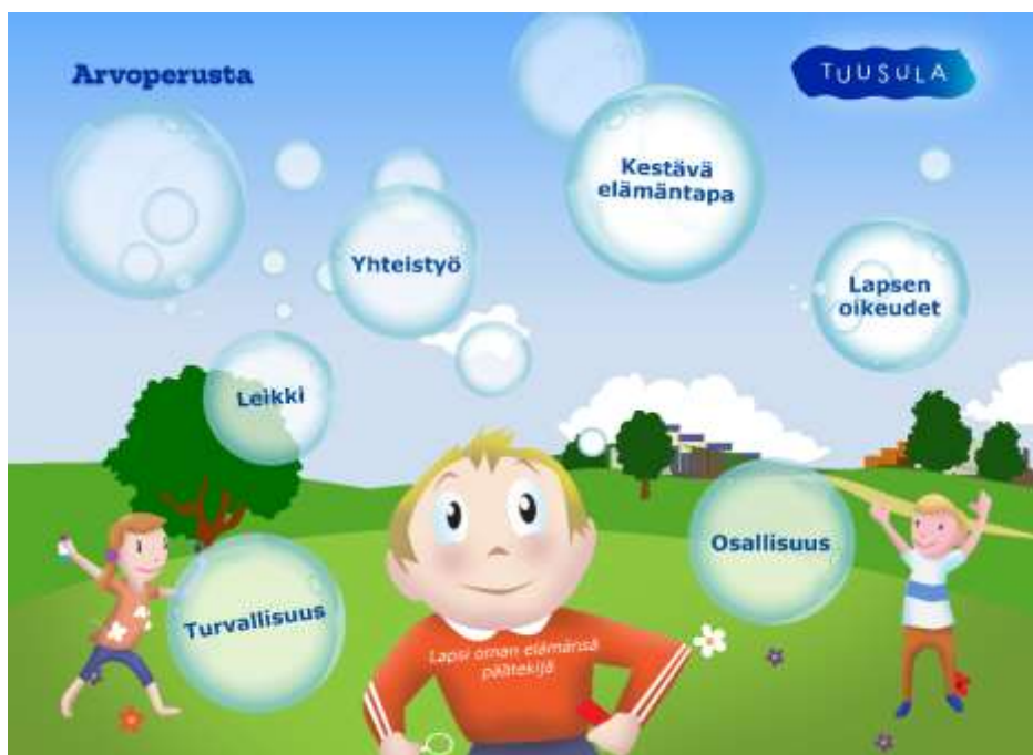
Kuva 1. Arvoperusta

Tuusulassa annetaan lapsille mahdollisuus kasvaa ja kehittyä turvallisessa, kestävästi kehittyvässä ja kulttuuriltaan rikkaassa kotikunnassa. Kaksivuotisen esiopetuksen perustehtävänä on rakentaa yhteisö, jossa lapsilla on hyvät edellytykset olla aktiivinen toimija. Lapsi kasvaa ottamaan vastuuta itsestään ja ympäristöstään yhdessä esiopetushenkilöstön kanssa. Tavoitteena on lasten osallisuuden vahvistaminen, hyvinvoinnin lisääminen ja syrjäytymisen ennalta ehkäiseminen.