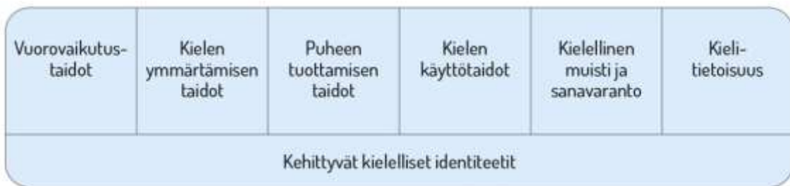
Kuva 4. Lasten kielen kehityksen keskeiset osa-alueet esiopetuksessa.

Kielen oppimisen kannalta on tärkeää tiedostaa, että saman ikäiset lapset voivat olla eri vaiheissa kielen kehityksen eri osa-alueilla. Lasten kielelliset identiteetit (kuvio 1) kehittyvät, kun heitä ohjataan ja tuetaan kielellisten taitojen ja valmiuksien keskeisillä osa-alueilla.