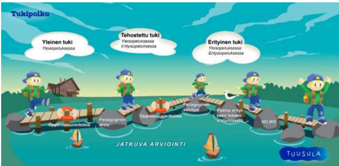
Kuva 7. Tukipolku

Kaksivuotinen esiopetus antaa lapselle aikaa rauhassa kehittää oppimisvalmiuksiaan leikin ja muun tavoitteellisen toiminnan avulla. Kaksivuotinen esiopetus tasoittaa lasten oppimisvalmiuksien eroja ennen koulun alkua. Samalla oppimisvalmiuksia pystytään tukemaan kaikkien lasten osalta aikaisemmin.