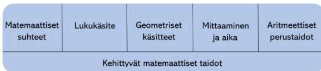
Kuva 6. Lasten matemaattisen kehityksen keskeiset osa-alueet esiopetuksessa

Lapsia innostetaan pohtimaan ja kuvailemaan matemaattisia havaintojaan erilaisissa arjen tilanteissa opettajan mallintamisen ja kielellistämisen avulla. Lapsia innostetaan jakamaan toisilleen havaintojaan ja syventämään sitä kautta yhteistä ajattelua, ongelmanratkaisutaitoja ja toimintaa. Toiminta suunnitellaan niin, että se tarjoaa lapselle mahdollisuuksia opetella ja käyttää matemaattisia käsitteitä, luokitella, vertailla, asettaa järjestykseen asioita ja esineitä sekä löytää ja tuottaa säännönmukaisuuksia. Opetukseen kuuluu muistia ja loogista ajattelua kehittäviä leikkejä ja tehtäviä. Opetus on leikillistä ja siinä hyödynnetään leikkejä, pelejä ja tarinoita sekä tieto- ja viestintäteknologiaa.