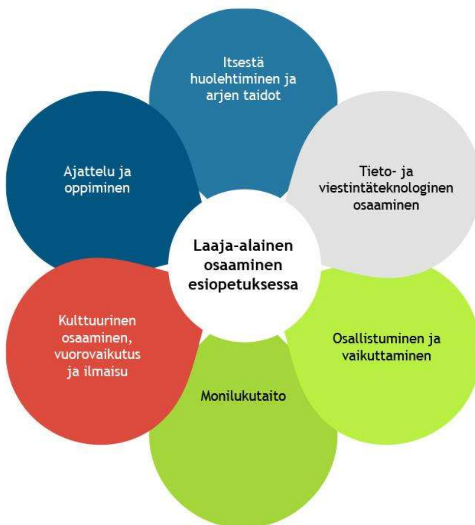
Kuva 2. Laaja-alainen osaaminen

Tuusulan kunnan esiopetuksessa työskennellään monipuolisesti erilaisissa ryhmissä. Työskentely voidaan aiheesta riippuen toteuttaa pareina, pienryhmässä sekä suuremmissa ryhmissä. Esiopetuksen henkilöstö tukee lapsen osallisuutta omaan oppimiseen ja arkeen. Toiminnan oppisisältöjä ideoidaan ja suunnitellaan yhdessä lasten kanssa. Esiopetuksen toiminnassa korostuu lapsen oppimisen prosessi, ei niinkään lopputulos. Esiopetuksen oppimisympäristöjen rakentamisessa huomioidaan lapsen osallisuus. Oppimisympäristöjä suunnitellaan ja muokataan yhdessä lasten kanssa oppimisen tavoitteita tukeviksi.