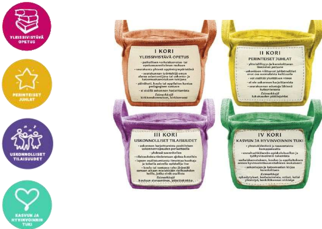
Kuva 5. Korimalli

Tuusulassa esiopetusryhmä voi kutsua seurakunnan työntekijän ja muun yleissivistävän katsomuskasvatuksen edustajan alustamaan yhteistä toimintaa esimerkiksi lapsiryhmästä nousseen eettisen kysymyksen pohjalta. Yhteistyö Tuusulan seurakunnan korimalleihin, jotka ohjaavat katsomuskasvatusta.