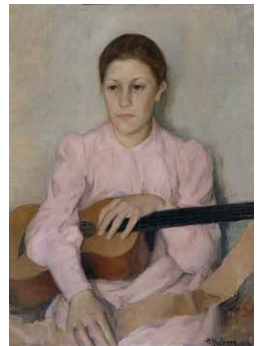
Pekka Halosen maalaus "Soittotunnin jälkeen" vuodelta 1894. Villa Gyllenbergin taidekokoelma.

Näyttelyn tarkoitus on myös tuottaa uusia tulkintoja Pekka Halosen maalauksista sävel- ja sanataiteen keinoin. Monitaiteellisella tulkinnalla pyydetään katsojaa pysähtymään hetkeksi taiteiden äärelle – moniaistisuus voi ilostuttaa, hämmästyttää, virkistää, saada unelmaan tai rentouttaa. Tunteiden kirjo on tässä näyttelyssä katsojan työkalupakki. Musiikin ja kuvataiteen yhteisvoimalla halutaan sekä muistuttaa talon monitaiteellisista perinteistä että taiteen voimasta ja tarpeesta tässä ajassa.