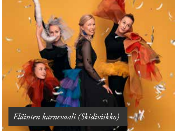
Eläinten karnevaali (Skidiviikko)