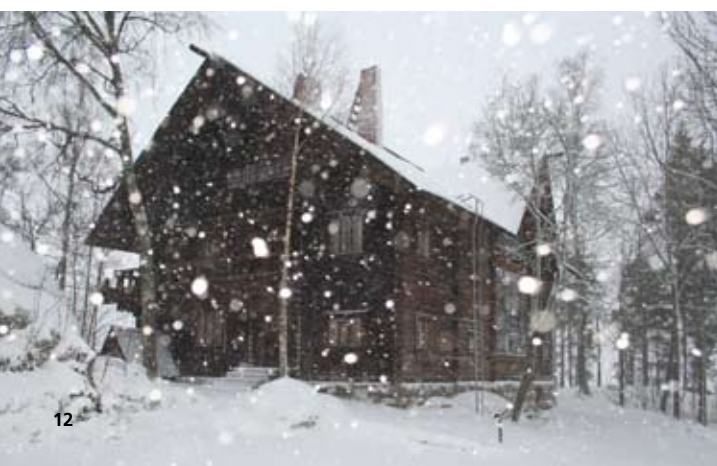
Halosenniemi lumisateessa.

Tiedustelut ohjaaja Tiina Häkkinen p. 040 715 0009