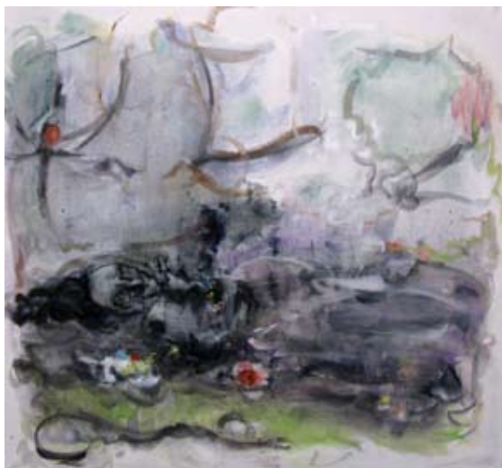
Tunteiden virta (Millais'n lampi) 2008 öljy kankaalle 150 x 160

Halosenniemi Rantatie, Tuusula www.halosenniemi.fi Avoimna ti–su 12–17