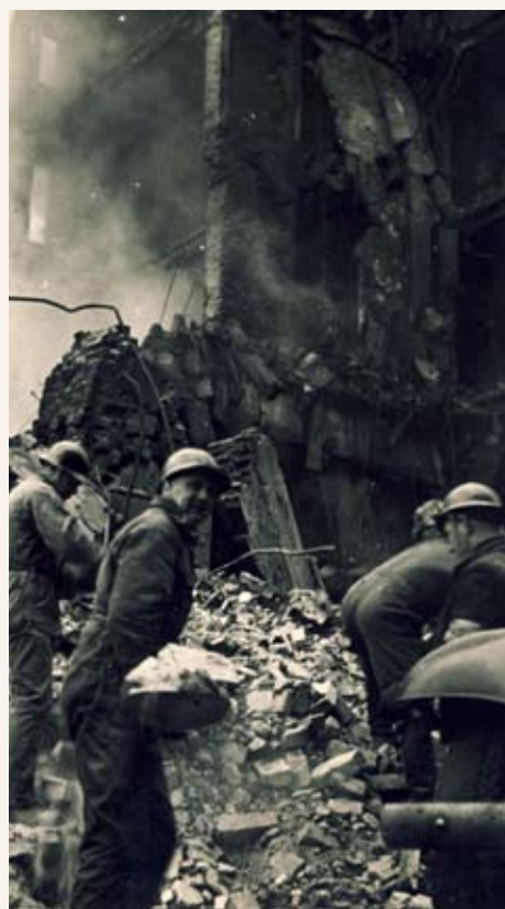
Uhreja etsimässä. Suomalaiset ilmasuojelunmiehet ovat kaivamassa ja raivaamassa talon raunioita Helsingissä.

Emme ole unohtaneet - talvisodasta 70 vuotta -luentosarja Evl. Ilmari Hakalan luennot lähestyvät talvisodan tapahtumia ihmisläheisestä näkökulmasta. Luentoja elävöittää myös musiikki ja runot. Liput 10 € / luento. 9.12. klo 18.30 Mannerheim: Miksi suomalaiset eivät taistele? 17.2. klo 18.30 Kuva talvisodasta 3.3. klo 18.30 Meilläkin oli sota