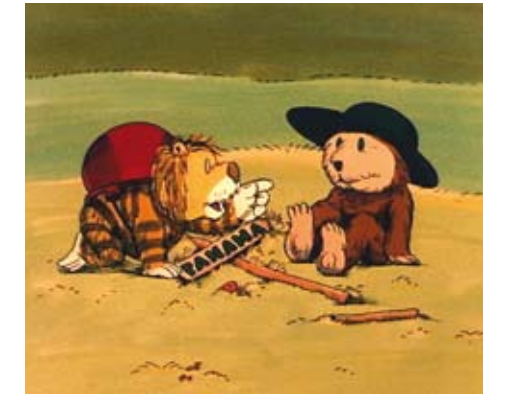
Animaatioelokuva "Oi ihana Panama" nähtiin syyskuun aamuleffatuokioissa.

Tuusulassa on katseltu syksyisin animaatioelokuvia Syysskiden Skidikino-esityksissä. Esitykset ovat olleet suosittuja ja poikkeuksetta täynnä. Syksyllä 2007 elokuvia alettiin esittää Skidikinojen lisäksi Taidekeskus Kasarmin näyttelytilassa. Parissa vuodessa elokuvat ovat löytäneet osittain vakiintuneen katsojaryhmän. Esityksissä käy päiväkotiryhmiä, perhepäivähoitajia sekä kotona lasten kanssa olevia vanhempia lapsineen.