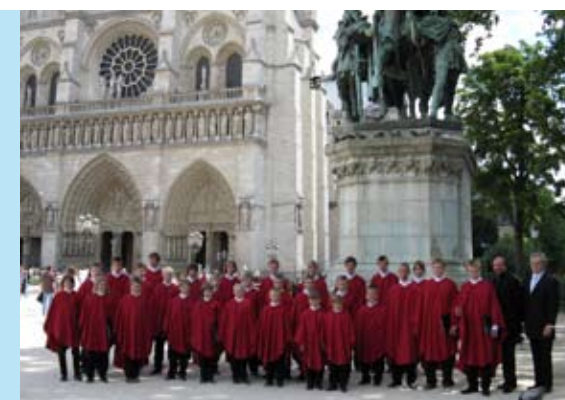
Poikakuoro Chorus Cathedralis Iuniorum esiintyy 15.11. Tuusulan kirkossa.