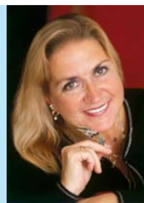
Erkkolan J. H. Klubissa Anja Snellman 19.11.

21.12. klo 18.30 Joululaulujen yhteislaulutilaisuus ja joulurauhan julistus. Vapaa pääsy. Jokelan kirkko, Kouluraitti 11. Järjestää Tuusulan seurakunta. Lisätietoja www.tuusulanseurakunta.fi, p. 040 778 9775.