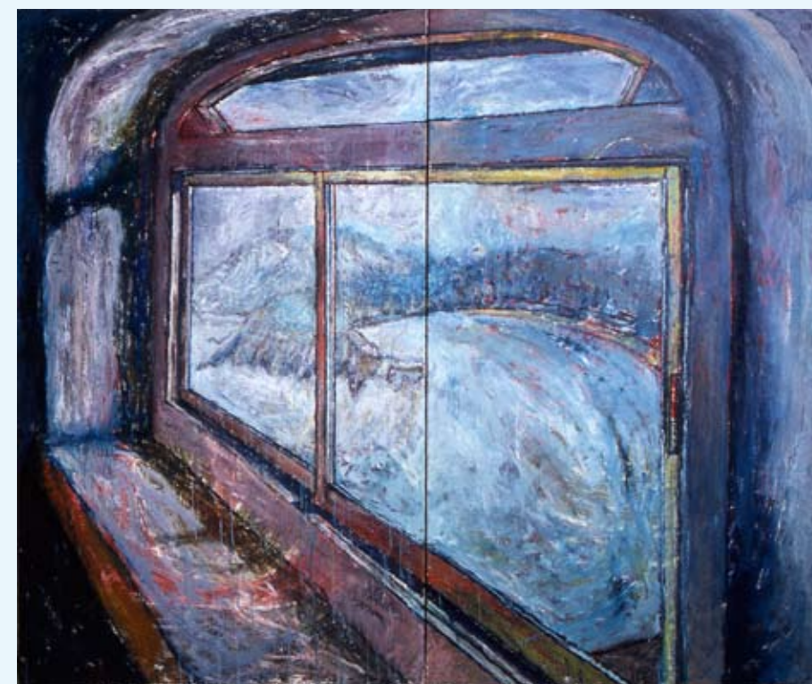
Eduardo Chillida Belzunce, Mi ventana 1989, öljy 162 x 194, Tuusulan Nykytaiteen museo/Aune Laaksosen taidesäätien kokoelma. Vaikuttava sisätilan perspektiivikuvaus espanjalaiselta kuvataiteilijalta.

sesti kaupunkia ja teoksessa on kaupungille tyypillisiä rakennusmateriaaleja – rautaa, betonia ja vaijereita ihmisten kasvomaskien ja käsioiden joukossa.