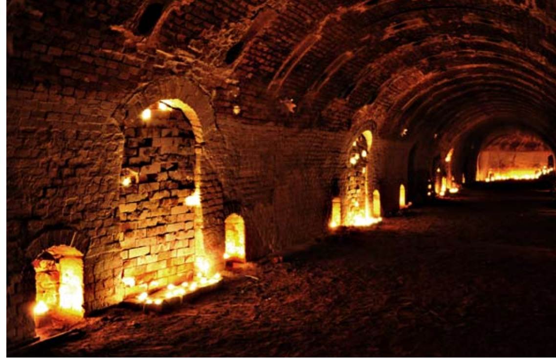
Tiilitehtaan rengasuuni tunnelmallisessa kynttilävalaistuksessa.

5.12.2009 klo 11–17 Klaavolantie 3, Tuusula p. (09) 8718 3461