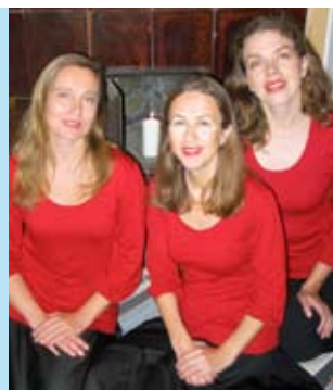
Singereiden joulukonsertti Erkkolassa 21.12. ja 22.12.

Näytelmän ensi-ilta on sunnuntaina 7.2.2010 klo 17 ja näytelmä esitetään tuttuun tapaan seuratalo Väinölässä, Kirkkotie 6, Tuusula.