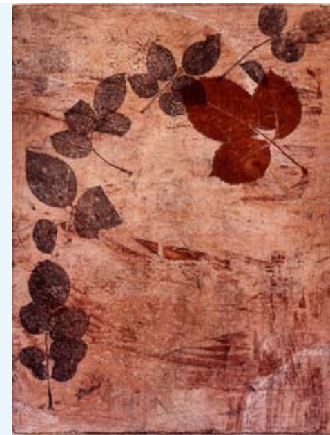
Johanna Koistinen, Tuuli 1997, etsaus 45 x 35, Tuusulan Nykytaiteen museo/Aune Laaksosen taidesäätien kokoelma. Teoksen maatuneen näköiset hauraat lehdet viittaavat paitsi syksyyn myös elämän ja kuoleman symboliikkaan.