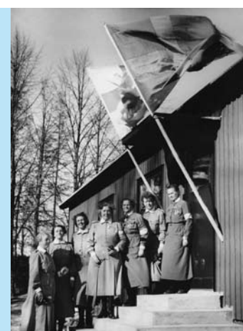
Näyttely "Ruotsin Maja kutsuu sinua" Syvärannan Lottamuseossa 31.3. asti.