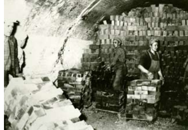
Jokelan Tiilitehtaan tiilenpolttouunia puretaan polton jälkeen 1950-luvulla.

Hyrylä, Kellokoski, Jokela Tapahtumiin vapaa pääsy. Järjestää tuusulalaiset kotiseutu- ja kulttuuriyhdistykset. Lisätietoja www.tuusula.fi/kulttuuri , p. (09) 8718 3436.