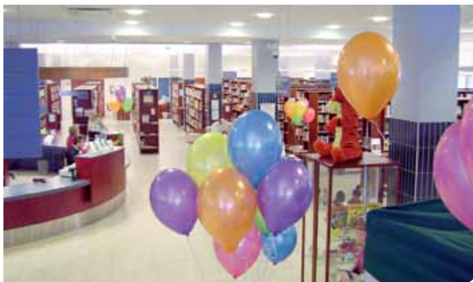
Viime vuoden kirjastokarnevaaleja juhliittiin sarjakuvateemalla.