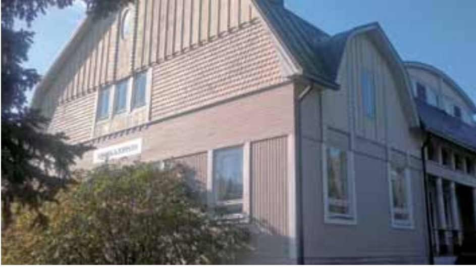
Kaunis Vanha Kunnantalo on kotina musiikkiopistolle.