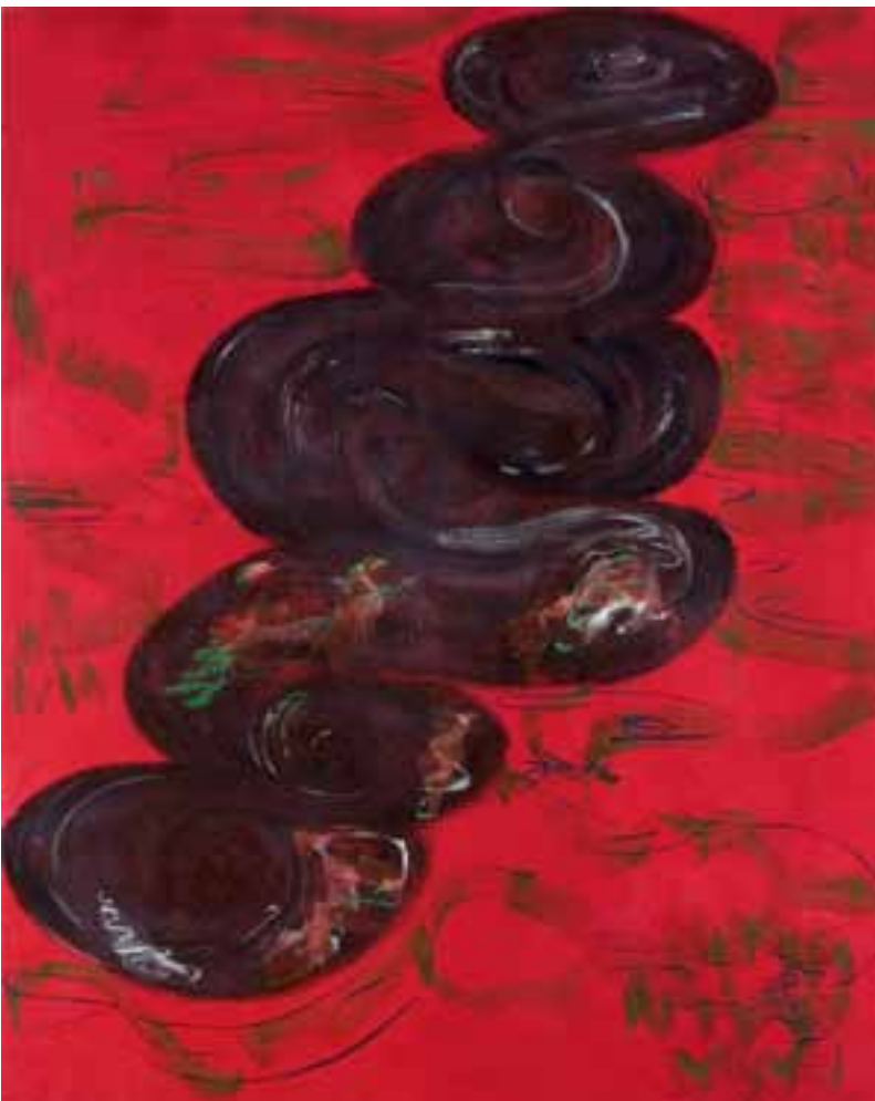
Markus Konttinen, Punainen joki 2008 , öljy 170x130