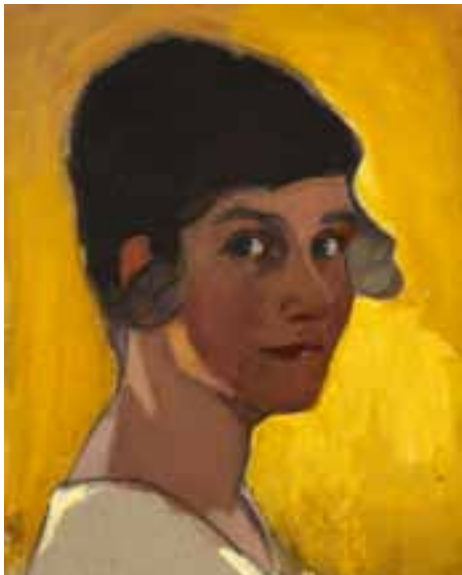
Martta Wendelin, Naisen muotokuva, guassi

Tuusulan kunnan taidekokoelmiin on kuulunut vuodesta 1982 alkaen kuvittaja ja taidemaalari Martta Wendelinin kuvituksia noin 1 900 kpl. Wendelin haki omat kuvituksensa WSOY:ltä ja Otavalta vuonna 1977 ja lahjoitti ne Tuusulan kunnalle. Kunnan kokoelmaan on lisäksi karttunut vuosien varrella Wendelinin öljy- ja pastellimaalauksia kymmenkunta. Nyt kokoelmaan lahjoitetun luonnoskokoelman taidokkaat piirustukset ja akvarelliluonnokset täydentävät kuvaa kaikkien tuntemasta kynäniekasta. Vaikka Wendelinin kuvitukset ovat teknisesti viimeistelyjä ja helposti syntyneen näköisiä, taustalla voi olla pitkäänkin kestänyt aiheiden kypsytys.