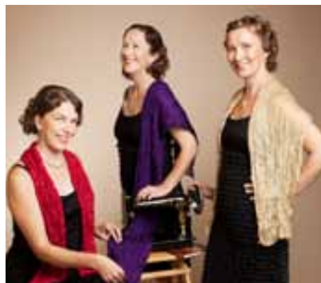
Singerit Erkkolassa.

Paijalanummentie 15, Tuusula. Järjestää Viihde- kuoro Essut ry. Lisätietoja www.essut.net, p. 041 441 9778.