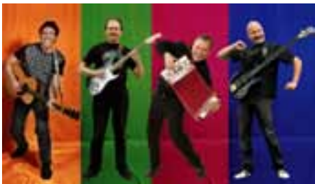
Pentti Rasinkangas ja Ohilyönti-orkesteri Tuusulassa isänpäivänä

7.–13.11. Lastenkulttuuriviikolla teatteria ja musiikkia ympäri Tuusulaa. Ohjelmassa mm. Pentti Rasinkangas Ohilyönti-orkestereineen perinteisessä isänpäiväkonsertissa Hyökkälän koulun auditoriossa 13.11. klo 15, liput 4 €. Järjestää Tuusulan kunta, lastenkulttuuri. Lisätietoja www.tuusula.fi/lastenkulttuuri, p. 040 314 3435.