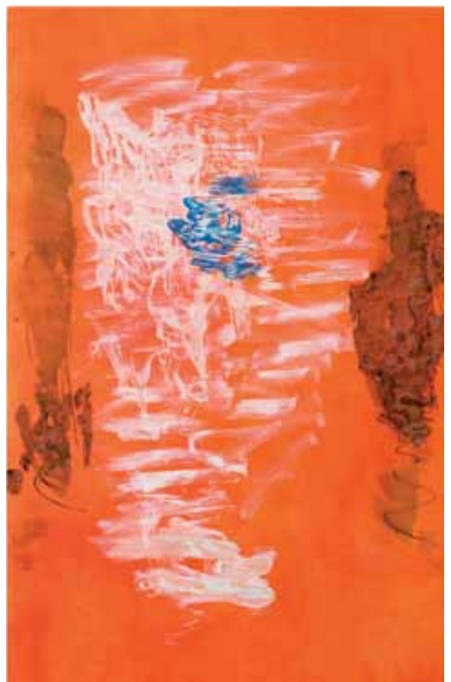
Markus Konttinen, Kohtaaminen auringon kanssa 2008 , öljy kankaalle, 220 x 130