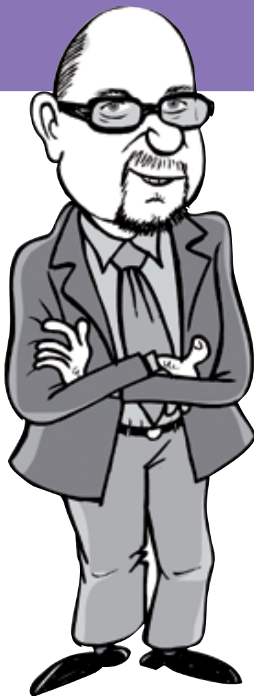
KUVITUS: Markku Haapaniemi