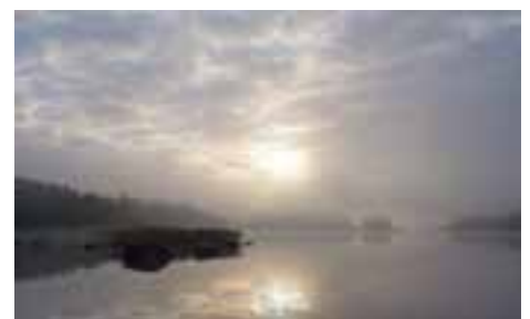
Tuusulan Valokuvaajat ry:n vuosinäyttely, Aamu-usva Saimaalla.

10.–19.4.2012 Esillä Taito Uusimaa ry:n tekstiilimallisto. Näyttelyn yhteydessä järjestetään taitopaja torstaina 12.4. klo 14–19. Pajassa valmistetaan keväisiä koristeita metallilangoista. Samalla voi tutustua käsityökeskuksen kevään kurssitarjontaan ja työpajoihin. Näyttely on ilmainen, pajassa materiaalimaksu.