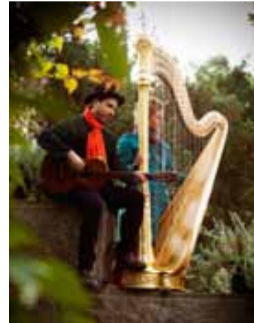
Muusa Klubi: Trubamolli

Keskisen Uudenmaan Musiikkiopisto ja Tuusulan kunta. Lisätietoja www.kum.fi , p. 040 315 2126 ja 040 508 3851.