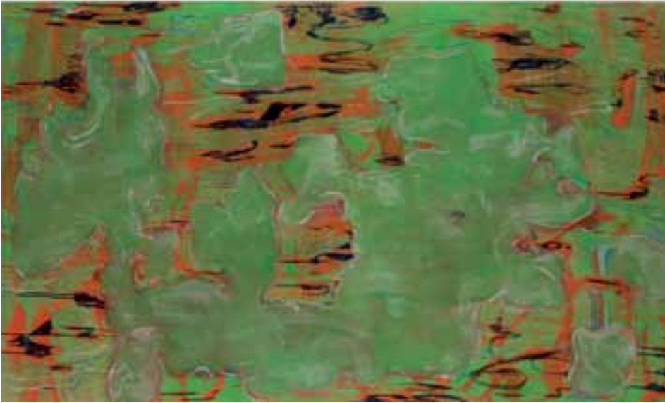
Markus Konttinen, Pilvi kelluu 2008 , öljy kankaalle 130x200, EMMA Saastamoisen säätiön kokoelmat