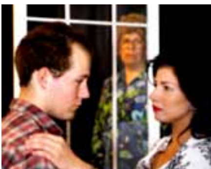
Äidin rakkaus.