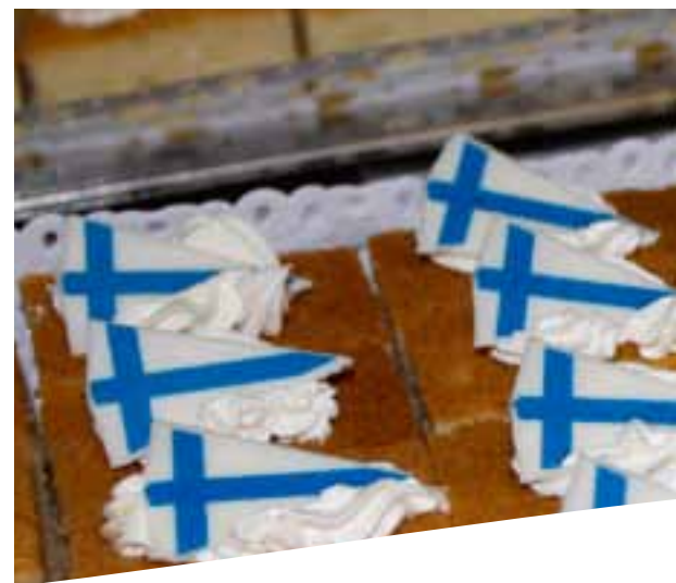
Juhlaynäinen herkkuuista odottamassa.