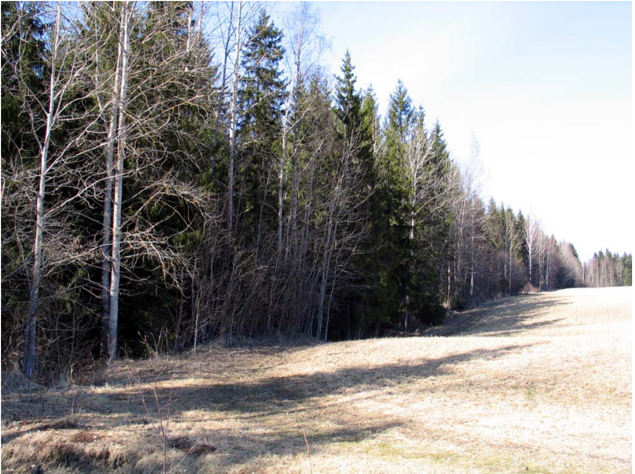
Kuva 2. Liito-oravalle soveltuvaa varttunutta kuusi-haapametsää kuviolla 129.

Alue on kuusivaltaista lehtoa, jossa kasvaa myös paikoin järeätä haapaa. Alueelta ei tehty liito-oravahavaintoja. Kuvion biotooppi on hyvin samankaltaista kuin kuviolla 97, jossa havaittiin liito-oravia, joten liito-oravan levittäytyminen etelässä sijaitsevalta esiintymisalueelta on mahdollista, mikäli viheryhteys toimii.