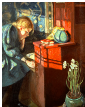
KUVA: Pekka Halonen. Lukeva tyttö 1913.

Museossa voi perehtyä Suomen sotilasperinteisiin ja -historiaan Ruotsin vallan ajalta nykypäivään. Museossa on kaksi näyttelyhallia sekä laaja ulkoalue ja museokahvila.