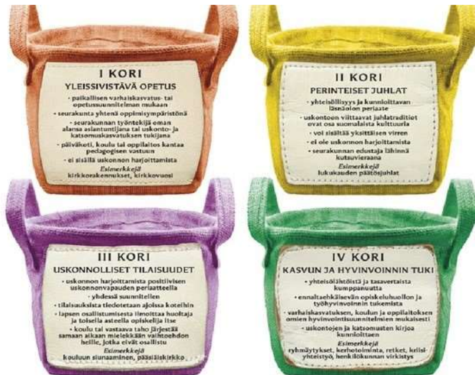
Kuva 6. Korimalli

Tuusulassa esiopetusryhmä voi kutsua seurakunnantyöntekijän ja muun yleissivistävän katsomuskasvatuksen edustajan alustamaan yhteistä toimintaa esimerkiksi lapsiryhmästä nousseen eettisen kysymyksen pohjalta. Yhteistyö pohjautuu valtakunnallisiin korimalleihin, jotka ohjaavat katsomuskasvatusta.