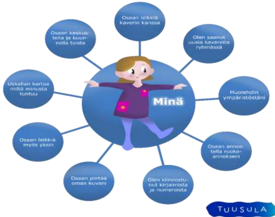
Kuva 5. Itsearviointi