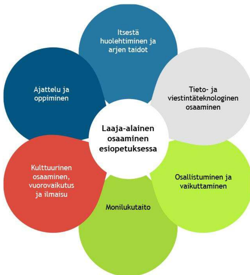
Kuva 2. Laaja-alainen osaaminen

Tuusulan esiopetuksessa käytetään monipuolisesti digitaalisia välineitä, sovelluksia ja pelejä. Esiopetuksen henkilöstö kehittää elinikäisen oppimisen periaatteella ammattitaitoaan hyödyntäen uusinta tietoa oppimisesta ja lapsen kehityksestä.