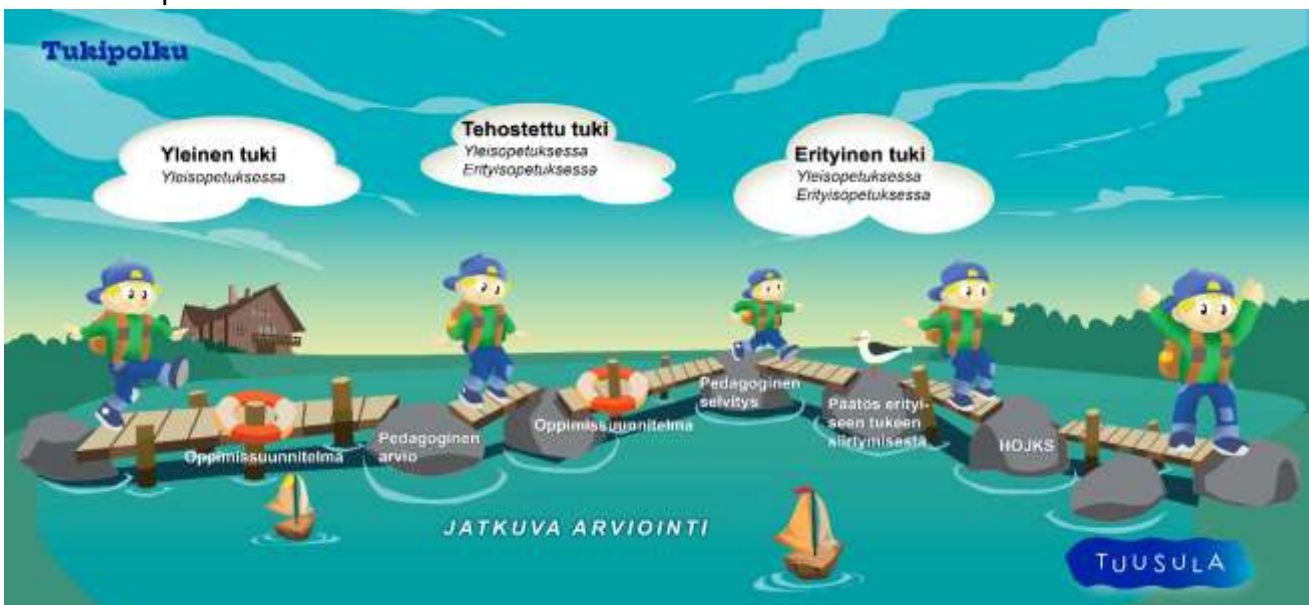
Kuva 8. Tukipolku

Kasvun ja oppimisen tuki on kuvattu tukipolkuuna, jonka lähtökohtana on hyvä esiopetuspäivä. Esiopetuksessa keskeisellä sijalla ovat oppimisjärjestelyt, jotka ovat joustavia ja jotka korostavat kaikkien lasten osallisuutta. Pedagogisilla ratkaisuilla, toteutettavilla menetelmillä ja riittäväillä tukitoimilla taataan osallistuminen ja mahdollisuus oppimiseen yksilöllisellä tavalla.