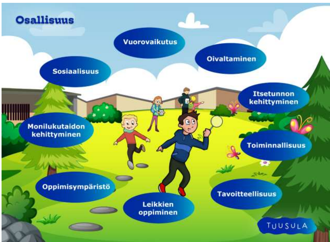
Kuva 4. Osallisuus

Henkilökunnan ja lasten huoltajien osaamisalueita ja ammatillisia vahvuuksia tulee hyödyntää lapsiryhmän ja koko varhaiskasvatusyksikön toiminnan suunnittelussa ja toteutuksessa; näin lisätään myös huoltajien osallisuutta esiopetuksen arjen toimintaan.