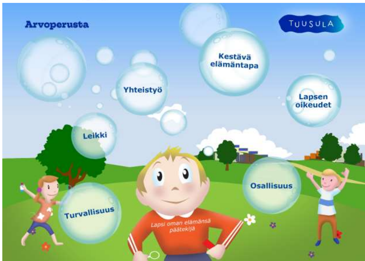
Kuva 1. Arvoperusta

Tuusulassa halutaan antaa ihmisille mahdollisuus kasvaa ja kehittyä turvallisesti. Kunnan perustehtävänä on rakentaa yhteisö, jossa ihmisillä on hyvät edellytykset ottaa vastuu itsestään ja ympäristöstään. Lähtökohtana ovat asukkaat ja heidän tarpeensa. Tavoitteena on kuntalaisten osallisuuden lisääntyminen ja syrjäytymisen ehkäiseminen sekä hyvinvoinnin lisääminen.