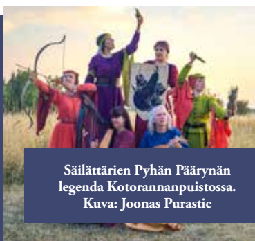
Säilättärien Pyhän Päärynän legenda Kotorannanpuistossa.