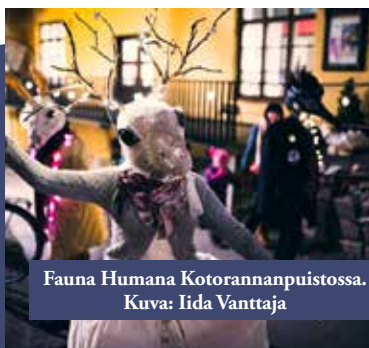
Fauna Humana Kotorannanpuistossa.