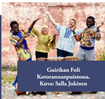
Guirikan Foli Kotorannanpuistossa. Kuva: Salla Jokinen