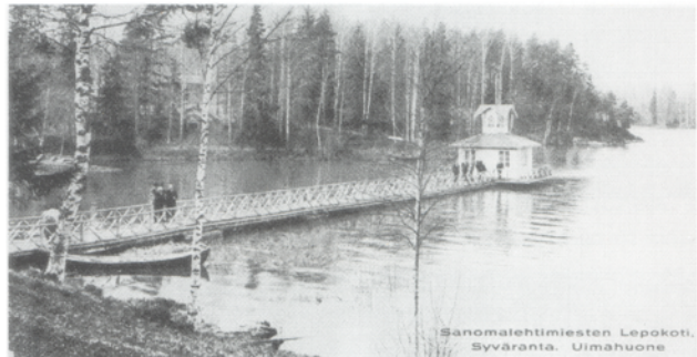
Syvärannan vanha uimahuone ja laituri.