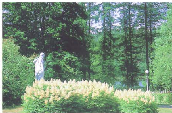
Töyhtöangervot ovat kasvaneet puutarhassa jo 1930-luvulla.