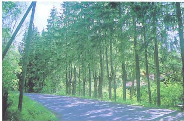
Ruotsin majan kuusiaita, joka on ollut matalaksi leikattu.