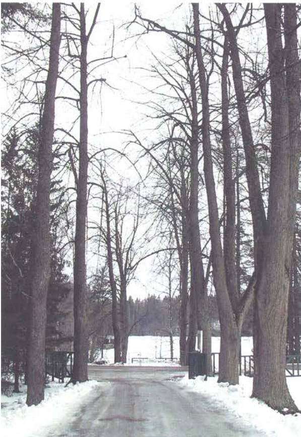
Uimalaituri ja -paviljonki ovat olleet rannalle johtavan lehmuskujanteen päätteellä.