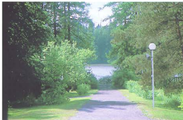
Syvärannan puutarhan pääakseli johtaa rantaan. Sarvikallio on sen päätteellä.