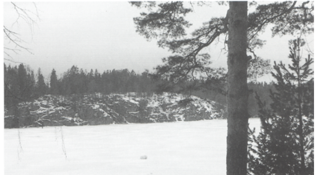
Ruotsin majan kohdalta Sarvikallio näkyy parhaiten.