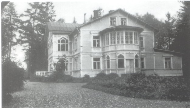
Syvärannan vanha päärakennus, joka paloi vuonna 1947. Vanhat valokuvat Syvärannan Lottamuseon kuvakokoelmista.