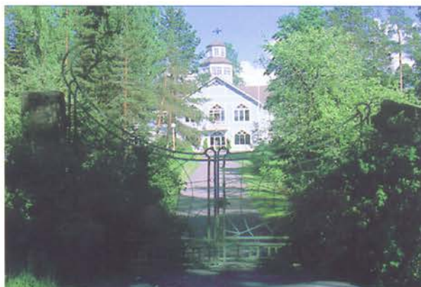
Syvärannan portti nykyisin.