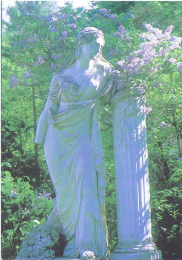
Syvärannan puutarhan loistokkaista koristeista on jäljellä vain marmorifiguuri.