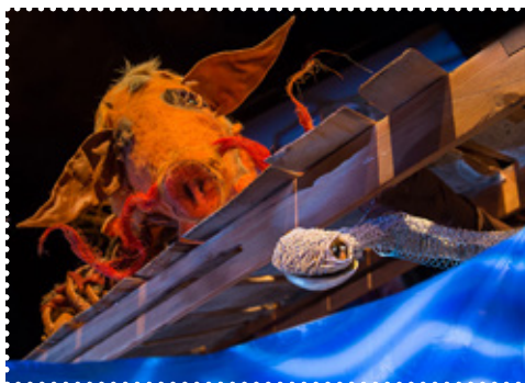
Kuva Jore Puusa

Tuntematon laatikko on laskeutunut hiirineiti Adalmiinan kotikannon katolle. Kaiken lisäksi laatikon sisältä kuuluu rapinaa. Adalmiina kipittää hämmennyksissään hakemaan Valtteri Villisikaa apuun. Valtteri on juuri kuullut hurjia uutisia: Käpykylään on muuttamassa käärmeitä! Ja käärmeet syövät hiiriä!