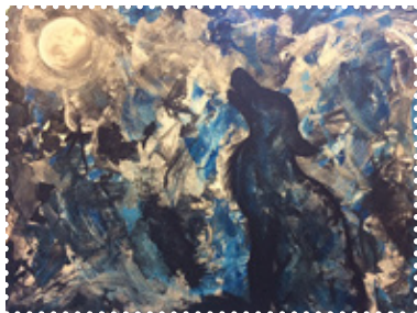
Maalaus Meeri Timonen

Näyttelyn avoimet avajaiset pe 24.3. klo 17–18. Tervetuloa!