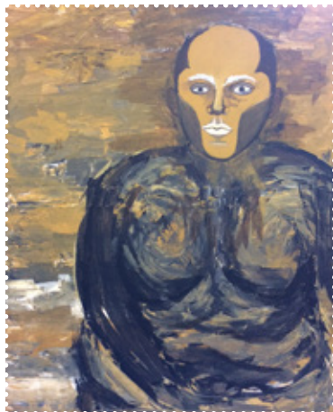
Maalaus Hilla Takkinen

Lisätietoja näyttelystä: web.tuusula.fi/lastenjanuortenkuvataidekoulu .