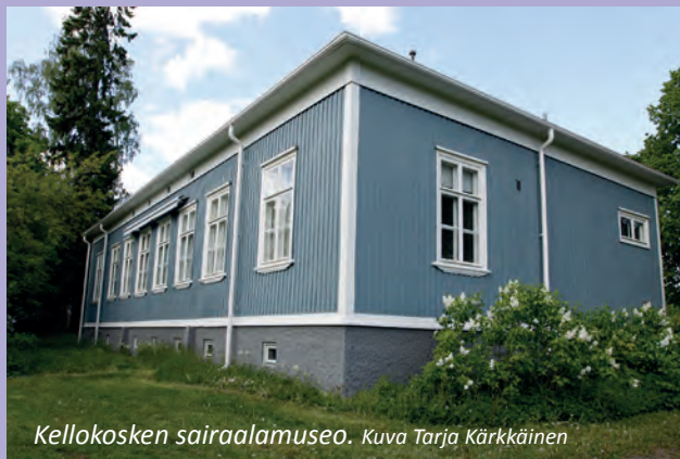
Kellokosken sairaalamuseo.

ke 10.10. klo 10–16 Aleksis Kiven päivä, vapaa pääsy