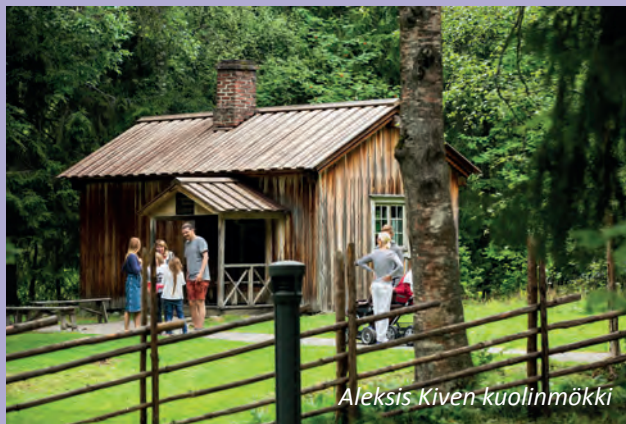
Aleksis Kiven kuolinmökki