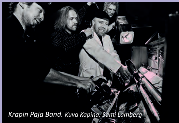
Krapin Paja Band.