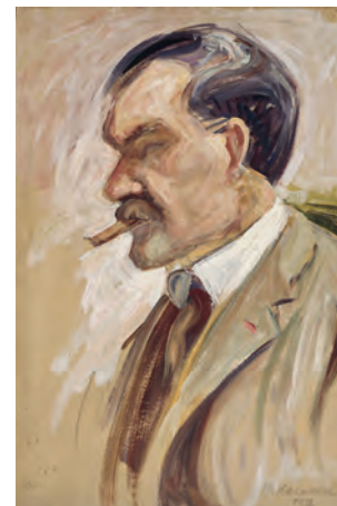
Pekka Halonen, Akseli Gallen-Kallela, 1912, WSOY:n kirjallisuussäätiö