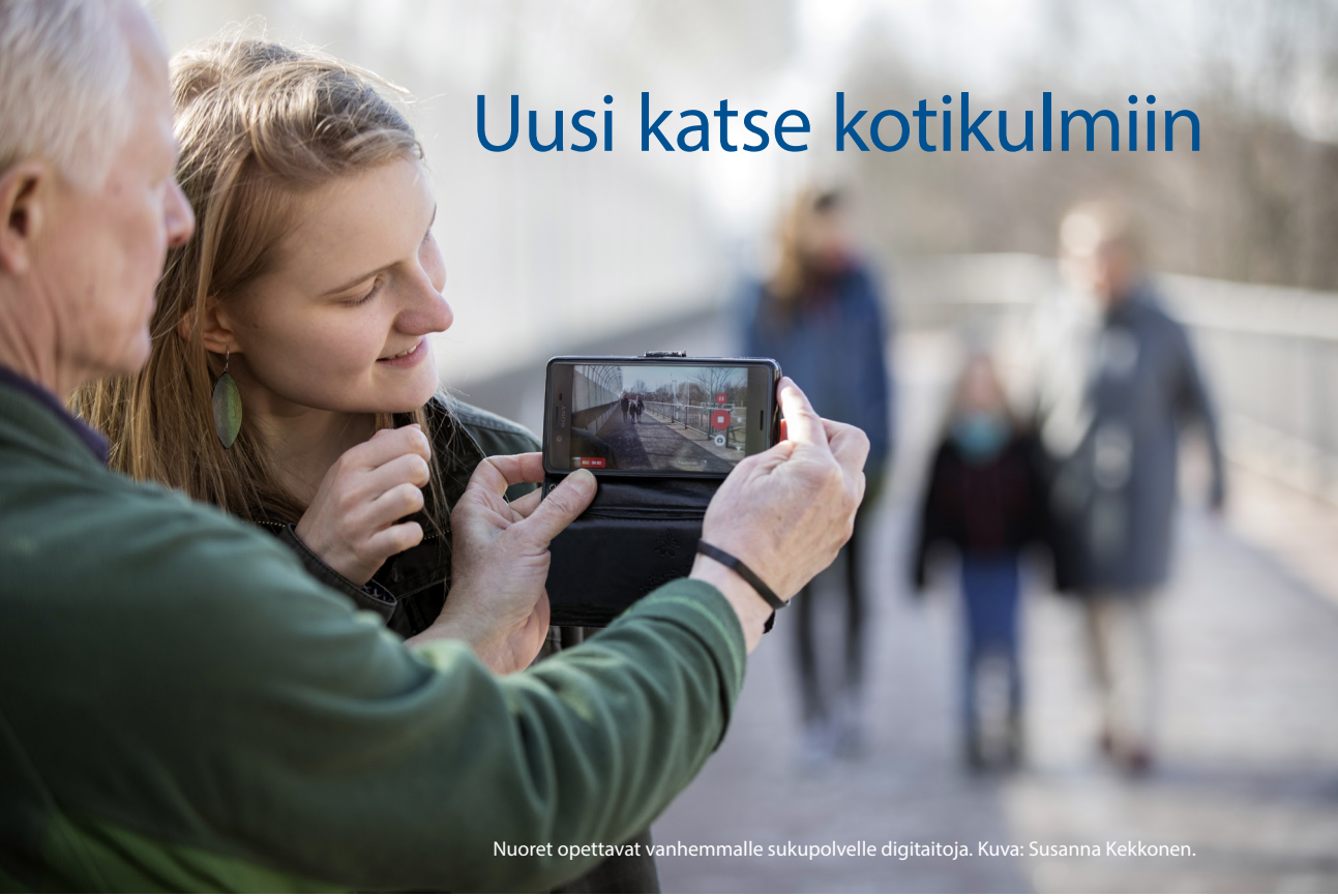
Nuoret opettavat vanhemmalle sukupolvelle digitaatioita.