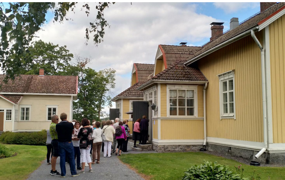
Sastamalan Wanhat Talot: Mattilan tila.

”Sastamalan Wanhat Talot -tapahtuma tuo esille upeiden vanhojen rakennusten lisäksi maaseudun yrittäjyyttä. Tapahtuman aikana on mahdol-