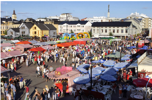
Kesäistä Oulun kauppatoria.

Vuonna 2021 elokuun 12.–15. Valtakunnalliset kotiseutupäivät järjestetään Oulussa, ja teemaksi on