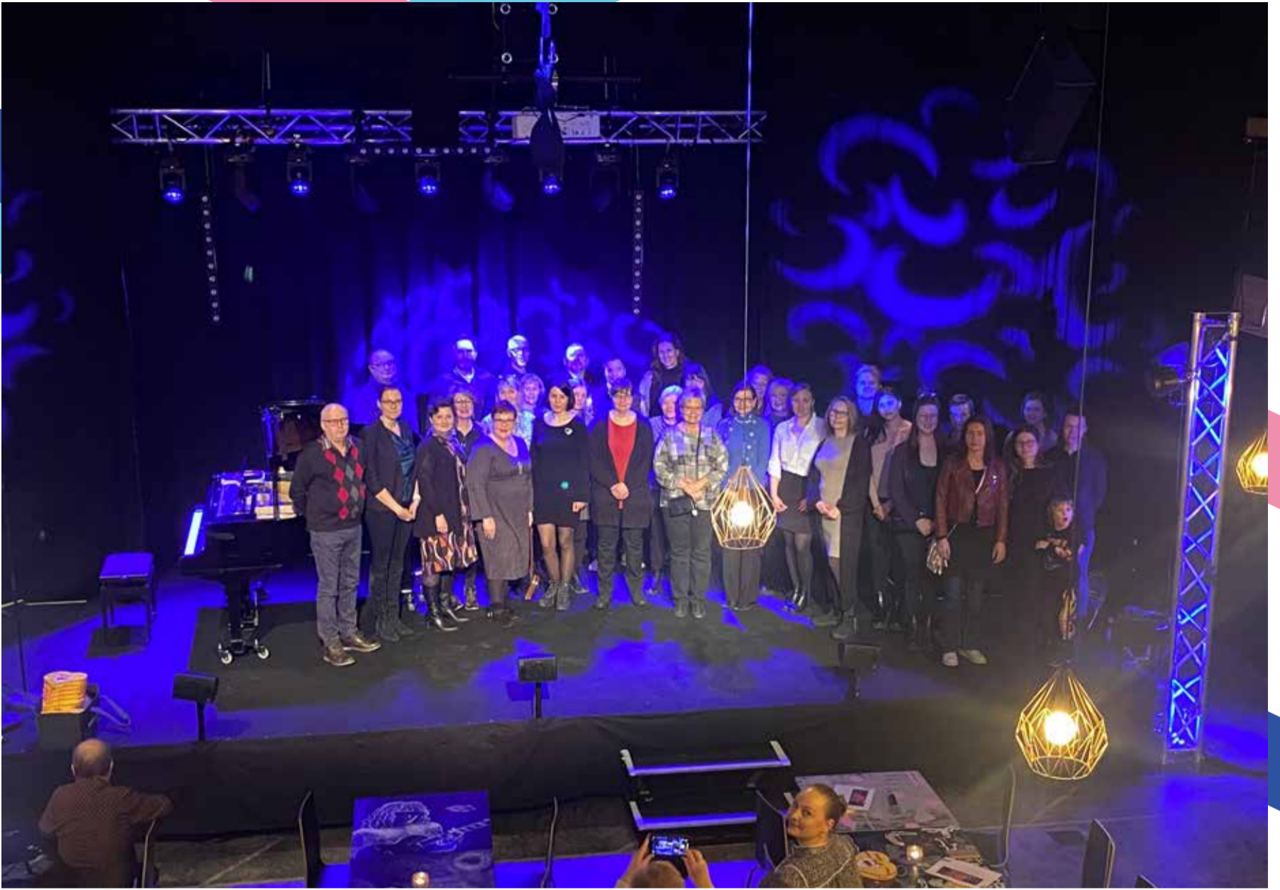
Palkituille ja ehdotetuille toimijoille järjestettiin yhteinen palkitsemistilaisuus ystäväpäivänä 14.2.

Sanomissa ja paikallisessa mediassa. Paikalliset yrittäjät, yhdistykset ja asukkaat toivat jälle ja sen tuntumaan kahvilatoimintaa.