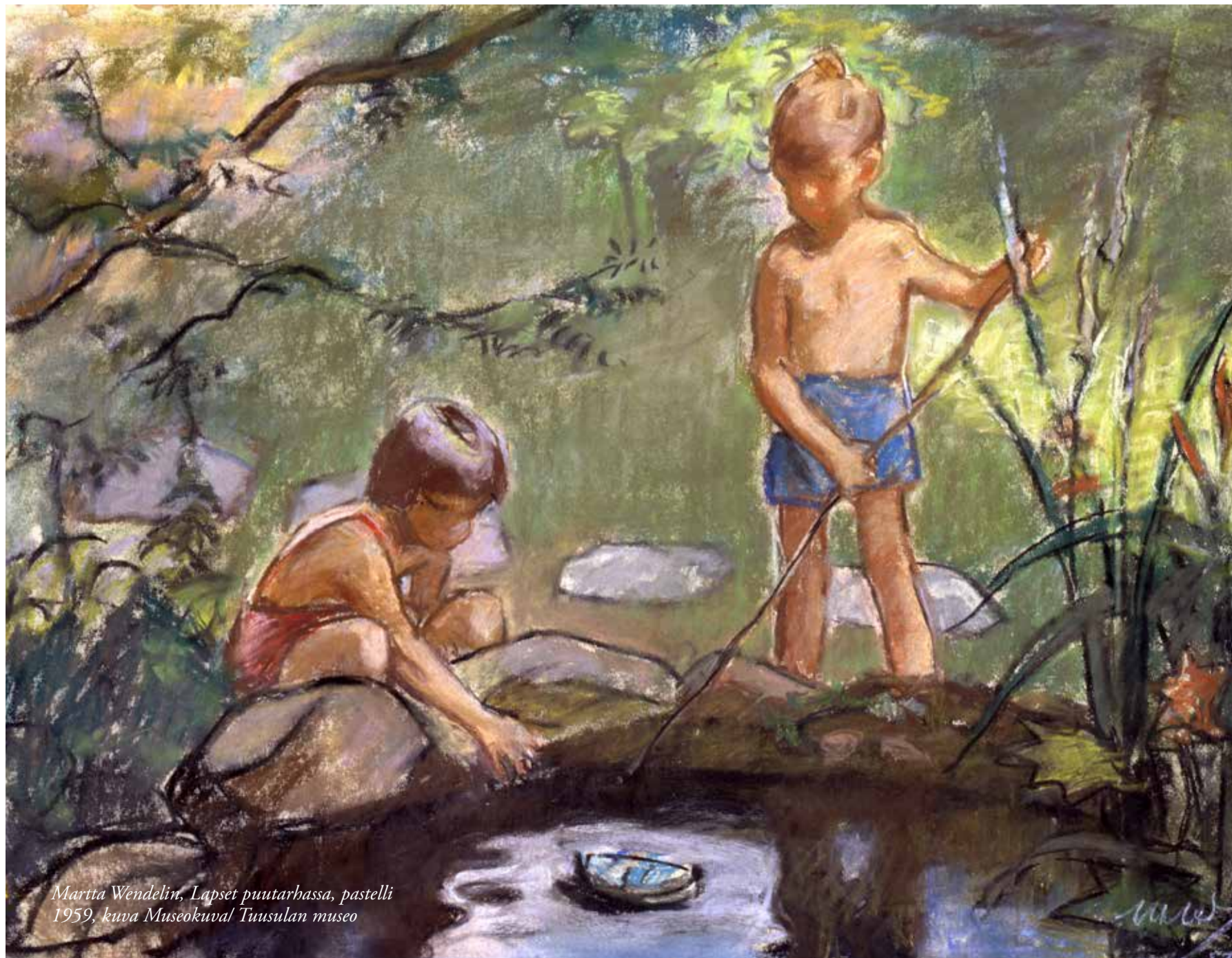
Martta Wendelin, Lapset puutarhassa, pastelli 1959

Valamon luostari Valamontie 42 79850 Uusi-Valamo valamo.fi