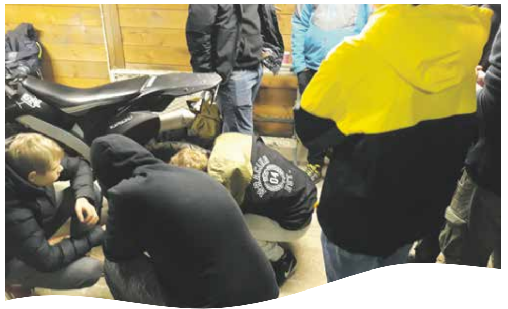
Teksti ja kuva: Henna-Mari Vasara

Hakuohjeet ja tilojen esittelyt www.tuusula.fi/yhteisotilat