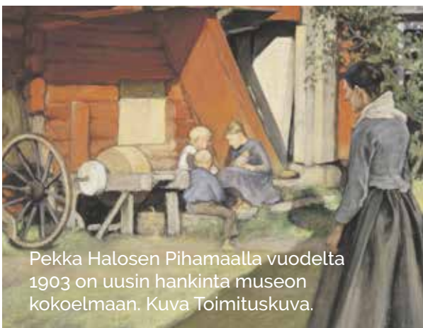
Pekka Halosen Pihamaalla vuodelta 1903 on uusin hankinta museon kokoelmaan.

Halosenniementie 4–6, Tuusula www.halosenniemi.fi