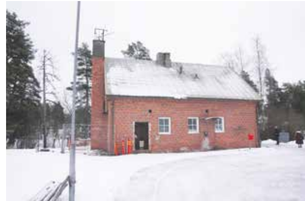
Yli-Jussilan kiinteistö ja Männistönpuiston rakennus.

Prijuutti on tarkoitus suojella, ja sen kunnostamista on määrä jatkaa samannimisen kansalaisyhdistyksen kanssa. ●