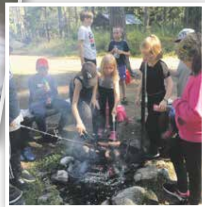
Lounastauko nuotion ääressä.