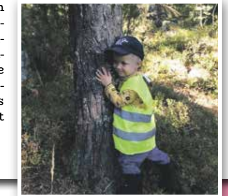
Näin puita halataan.